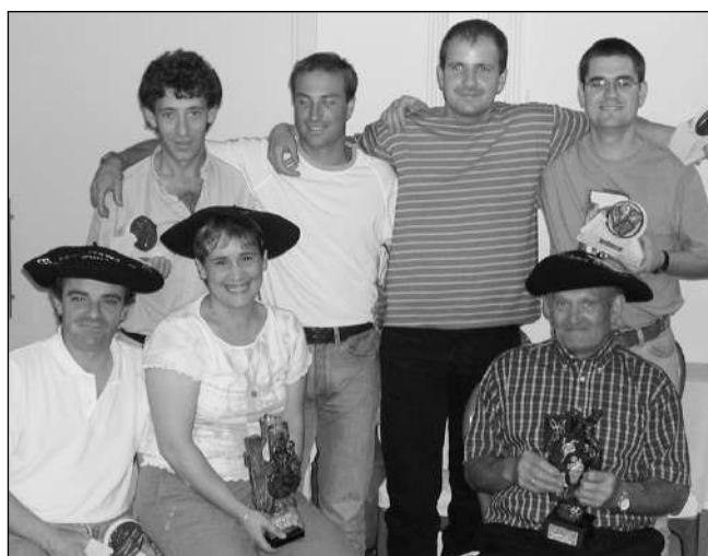
Saridunak Fagollaga jatetxean, joan den larunbatean.

Dantza Txapelketa arratsaldeko 17:30etan da Gudari Plazan. Eurria ari badu Sandiusterrin egingo da. □