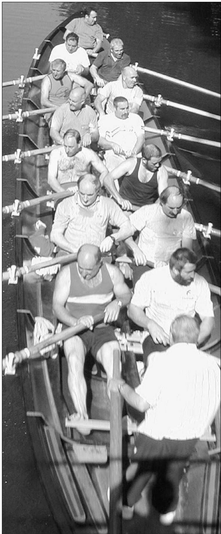
70eko hamarkadan arraunean ibiliak, berriz ere entrenatzen.