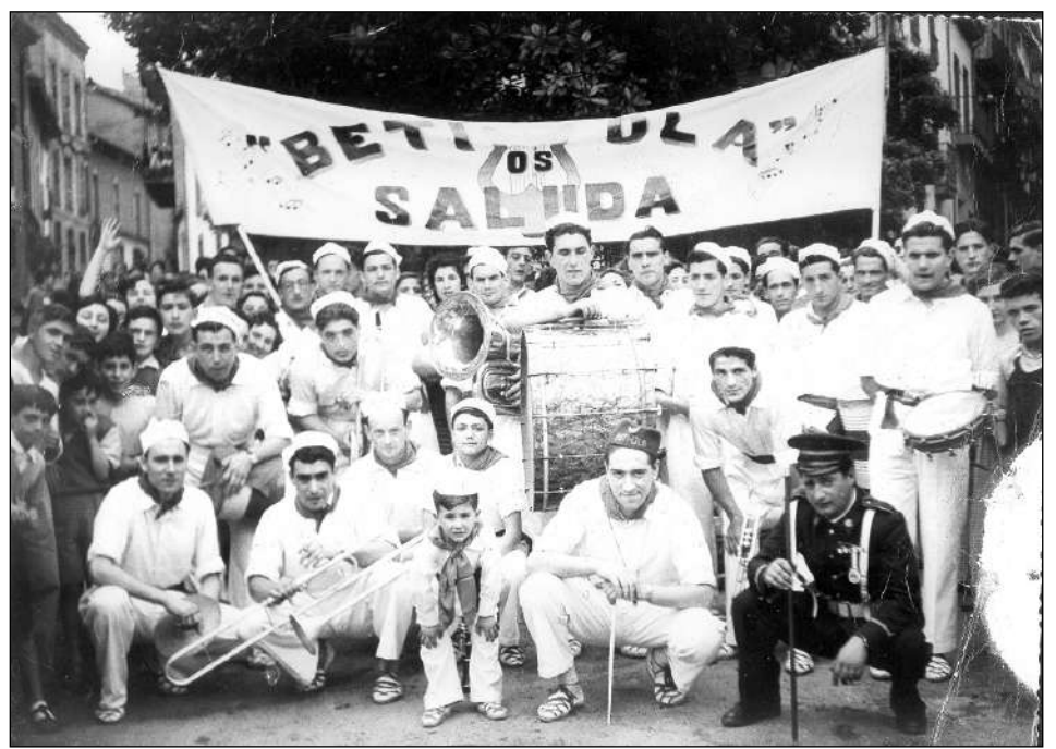
Betiola txarangaren lehenengo koadrila, 1953an.