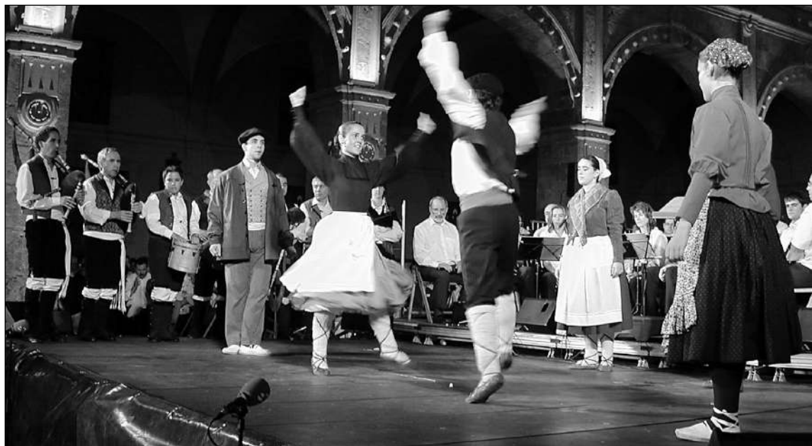
Hernaniko hiru bikoteak San Joan iragarpen kontzertuan dantzan.