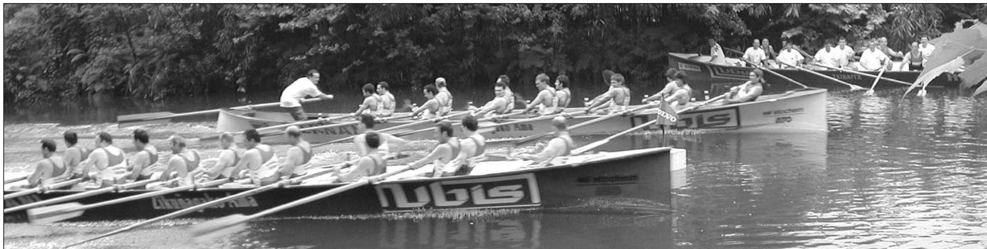
Gazteak (haruzkaldean) eta 90ko koadrila ia bate-batera helmugan sartzen. Arraunak elkar joka ere ibili zituzten bukaeran eta gazteek 48 zentesima aurretik sartu ziren.