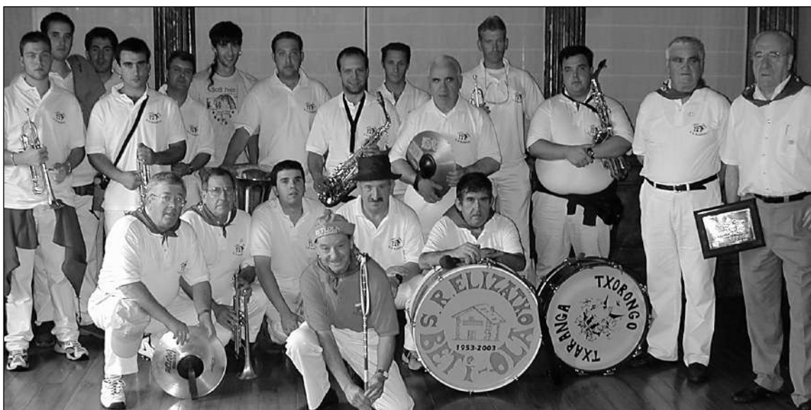
Goiko argazkian Betikoak taldea eta behean Betiola-Elizatxo txaranga.