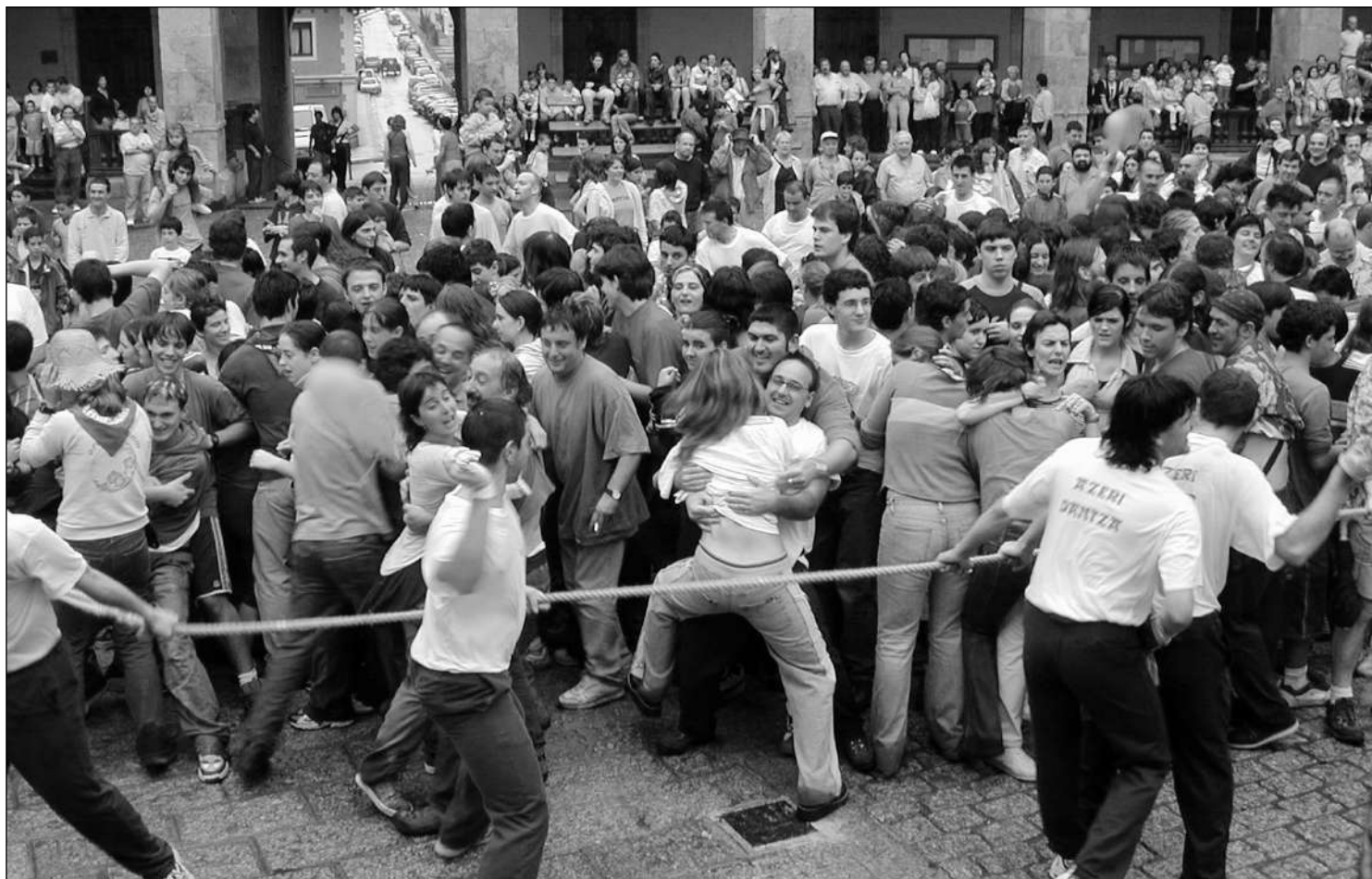
Axeri dantzan jende asko atera zen atzo, eta sokan zijoaztenek izan zuten nahikoa lan denentzat partitzen.