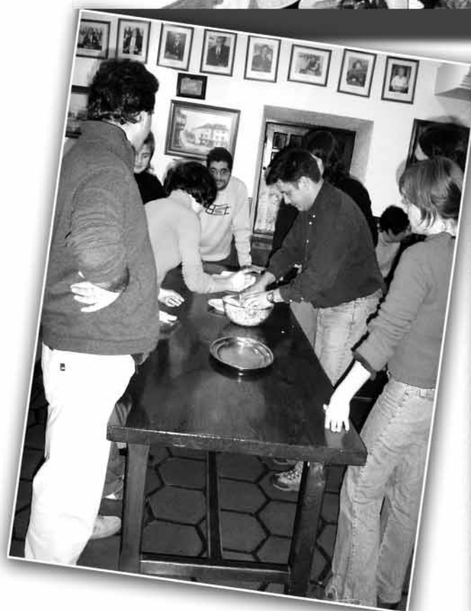
Zilegi-mendiak / II