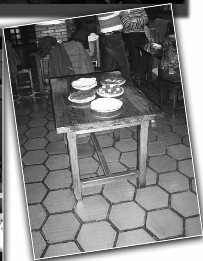
Zilegi-eskoletako gai emaileak / III