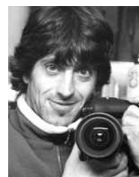
ALBERTO ELOSEGI - ARGAZKILARIA. ARGAZKILARITZA DIGITALA.

Oin azpian gure gorputz-atal guztiak islatzen dira. Oinetan masajeak emanez gozatu eta sendatzeko bidean nola jarri erakutsi digu.