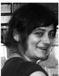
PAKI CABALLERO ETA TXURRI JATETXE BEJETARIANOKO SUKALDARIAK

Uste genuen baldarrak ginela, baina ze eskulan politak egin ditugun!