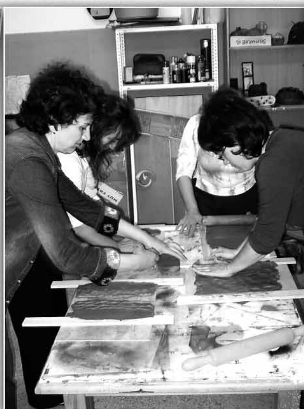
Zer dira zilegi-eskolak / II