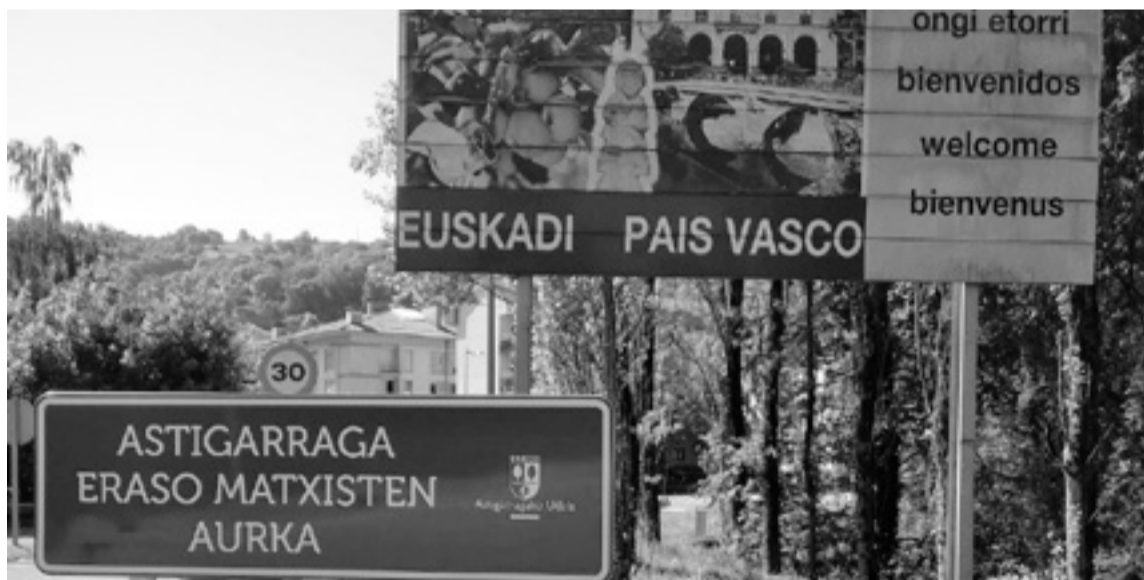
Indakeria matxistaren aurkako seinaleak jarri ditu Udalak herriko hiru sarreretan.

Hain zuzen, indakeria matxistarekin bukatzeko lanaren parte da seinaleak jarri izana. «Indakeria sexista da emakume izate hutsagatik jasaten dena eta helburu eta ondorioa emakumeen gaineko kontrola eta nagusitasu-