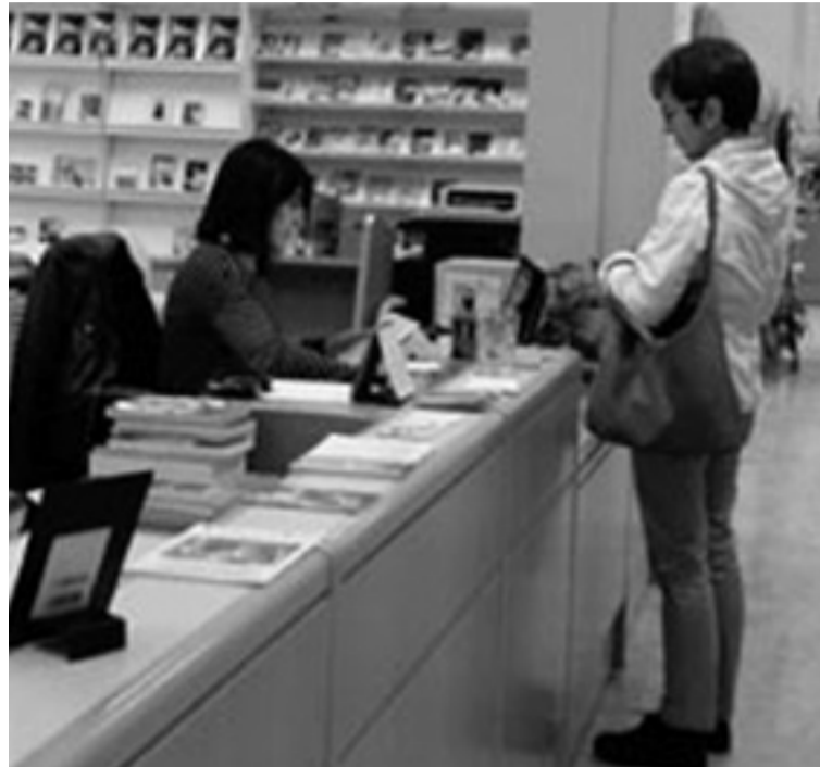
Aurretik hitzordua hartuta eta banan-banan sartu beharko da liburutegian.

Osasun eta higiene neurri gehiago hartuko ditrela ere jakinarazi dute, bestalde. Esaterako, maileguan hartutakoa itzultzeko, Biteriko sarreraren dauden kutxak erabili beharko dira. Horrela, hor utzitako materiala 15 eguneko berrogeialdian edukiko dute.