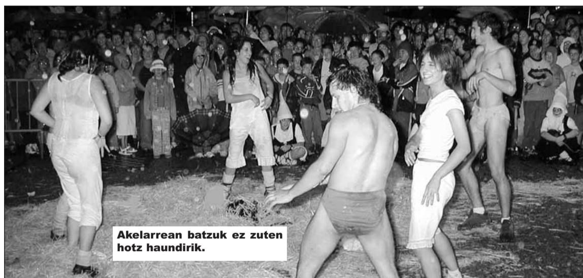
Akelarrean batzuk ez zuten hotz haundirik.