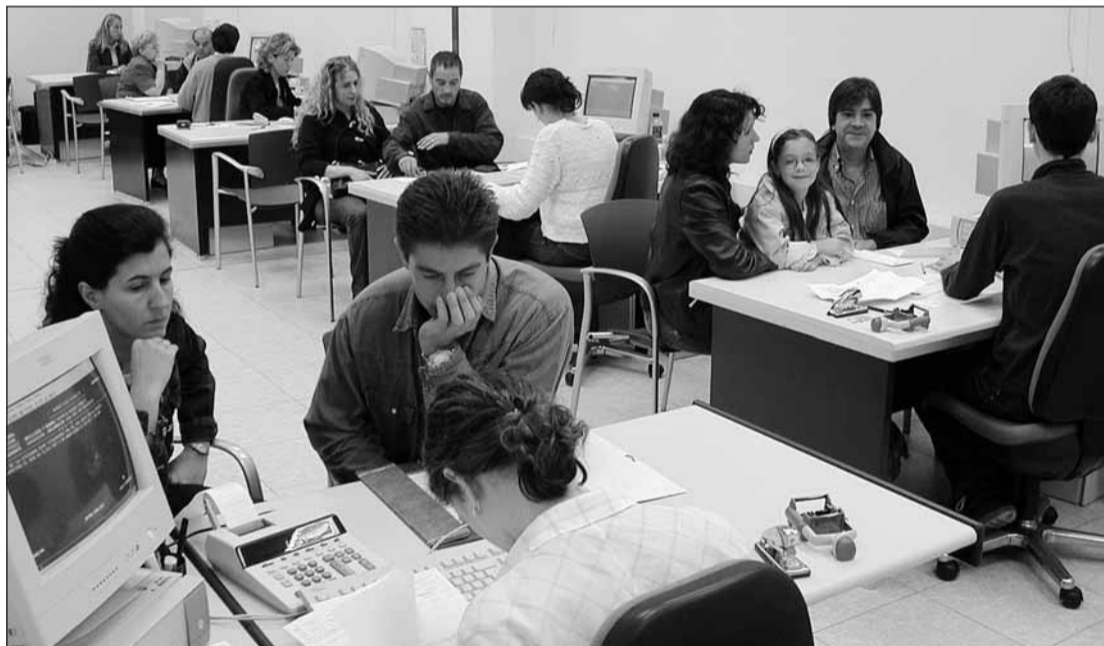
Astelehen goizean Errenta Deklarazioko ofizinan jende mugimendu handia ibili zen.