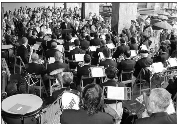
Hernaniko Musika Banda atzo kontzertua ematen.