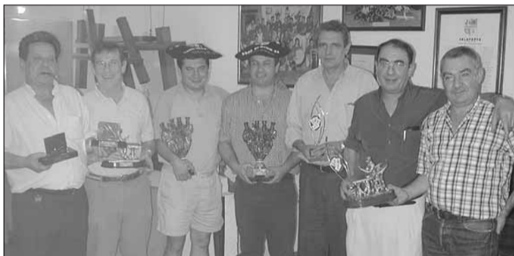
Mus txapelketako parte hartzaileak sari eta guzti.

Bost lagun zauritu ziren bi kotxek elkar jota. Igande arratsaldeko 17:10etan Renault Laguna eta Opel Vectra batek elkar jo eta bost lagun zauritu ziren, 3 gizonetako (G.U.G., G.M.G., eta J.A.I) eta bi emakumetzko (M.J.E.Z eta M.P.C.G.).