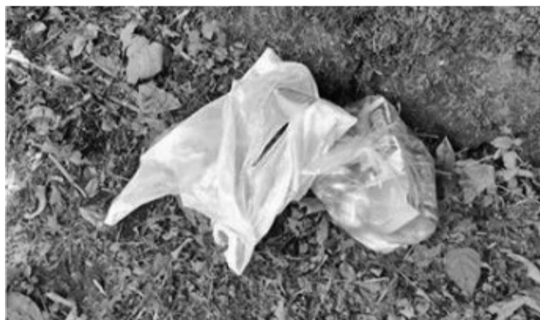
Latak, plastikoak... mota guztietako zaborra topatu dute Goizueta inguruan.

Aurreko asteburuko eguraldia aprobetxatzeko asmotan, askok erreka joateko plana egin zuten. Baina zenbaiten jarrerarekin kritiko azaldu da Goizuetako Udalak: «erreka bazterretan hurbiltzea oso ondo dago, baina zaborra bertan uztea ez».