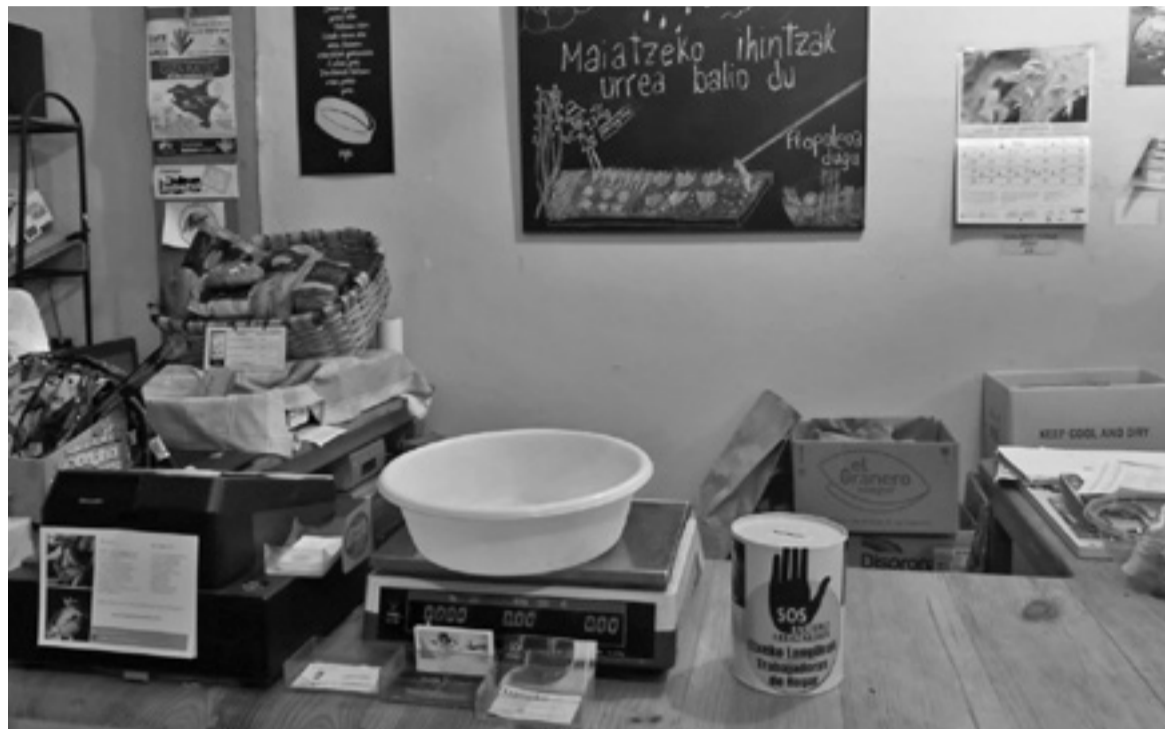
Kide, Lurreko, Aliprox eta Gardanberan aurkitu daitezke Erresistentzia kutxak.

Parte hartzeko deia luzatzeaz gain, mezu hau helarazi nahi izan dute: «zaindu ditzagun, zaintzen gaituztenak!». K