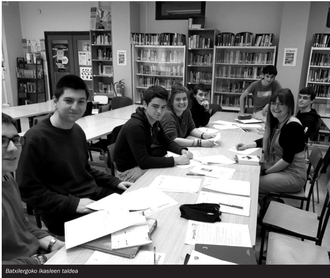
Batzilergoko ikasleen taldea

Bestalde ikasturtean zehar egiten dugun hainbat ekintza ere jarraitu dugu aurrera eramaten, hala nola, abenduan Udal Euskaltegiak antolatzen duen mintzodromoa dinamizatzen eta parte hartzen, Hernaniko Udalak sustatutako Irakurrituz Gozatu ekimena bultzatzen (Ikasleak Gaztezulo aldiakaria jaso eta irakur dezaten), Hernaniko Kronikarekin elkarlanean (egunero haren presentzia izateko ikastetxean eta Ikasleen Txokoa gehiga-