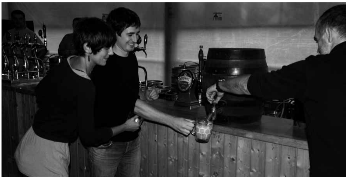
Kronikako langileek eman zioten hasiera V. Garagardo Azokari.

HERNANIKO Kronikako langileak izan ziren atzo V. Garagardo azokako lehen tragoa hartu zutenak. Kronikako langileek Errugbi elkarteari eskertu zioten azoka irekitzera gonbidatu izana, eta azpimarratu zituzten errugbi elkarteak bere ibilbidean egindako lana eta izandako lorpenak. Hastear dute denboraldirako zorterik onena eta animo guztia eman zizkieten. Garagardo basoari heldu eta «osasuna eta kemena!» esanez egin zuten topa bertara gerturatutako guztiakin.