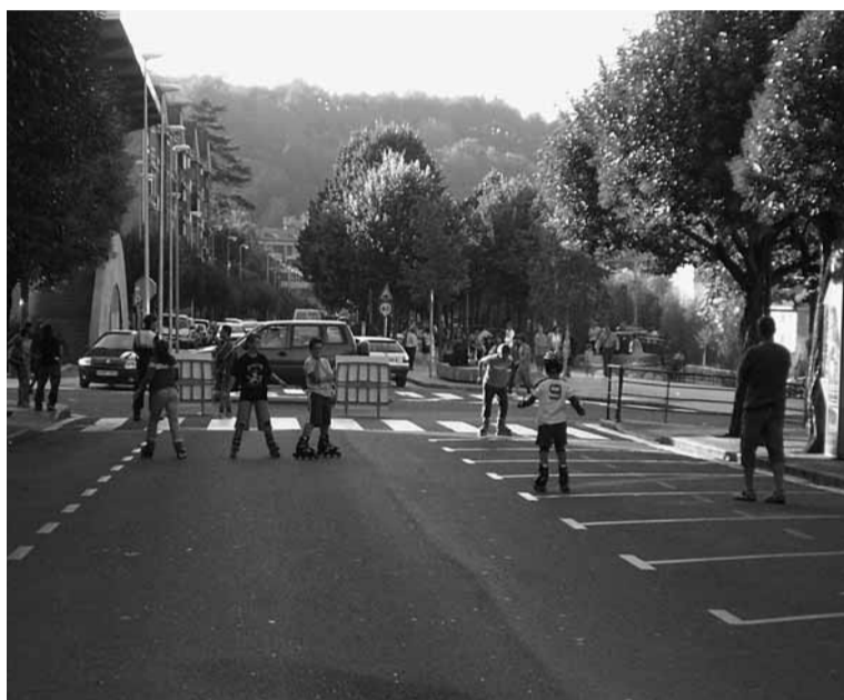
Urbieta kalea itxita dago egun hauetan, kotxeaz aparte garraioa bertan ibili dadin: patinak, oinezkoak, bizikletak...

Bihar goizeko 11:00etan hasita, Txantxangorri elkarte paretik abiatuko dira animatzen diren herritarrak, haur, gazte eta heldu. Ibilbidean zehar udaltzainak izango dira trafikoa mozten, beraz lasai ibili ahal izango da.