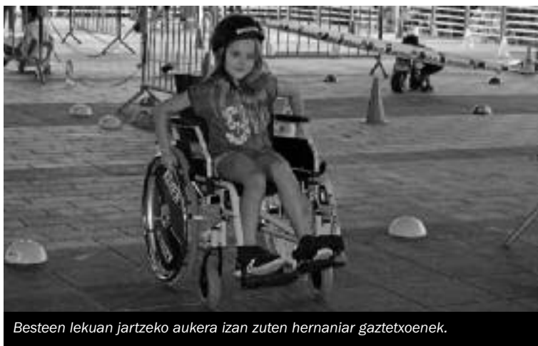
Besteen lekuan jartzeko aukera izan zuten hernaniar gaztetxoek.

Goizeko 10:00etan, Plaza Berrin elkartu eta patinetan ibilbide bat egiteko aukera izango da.