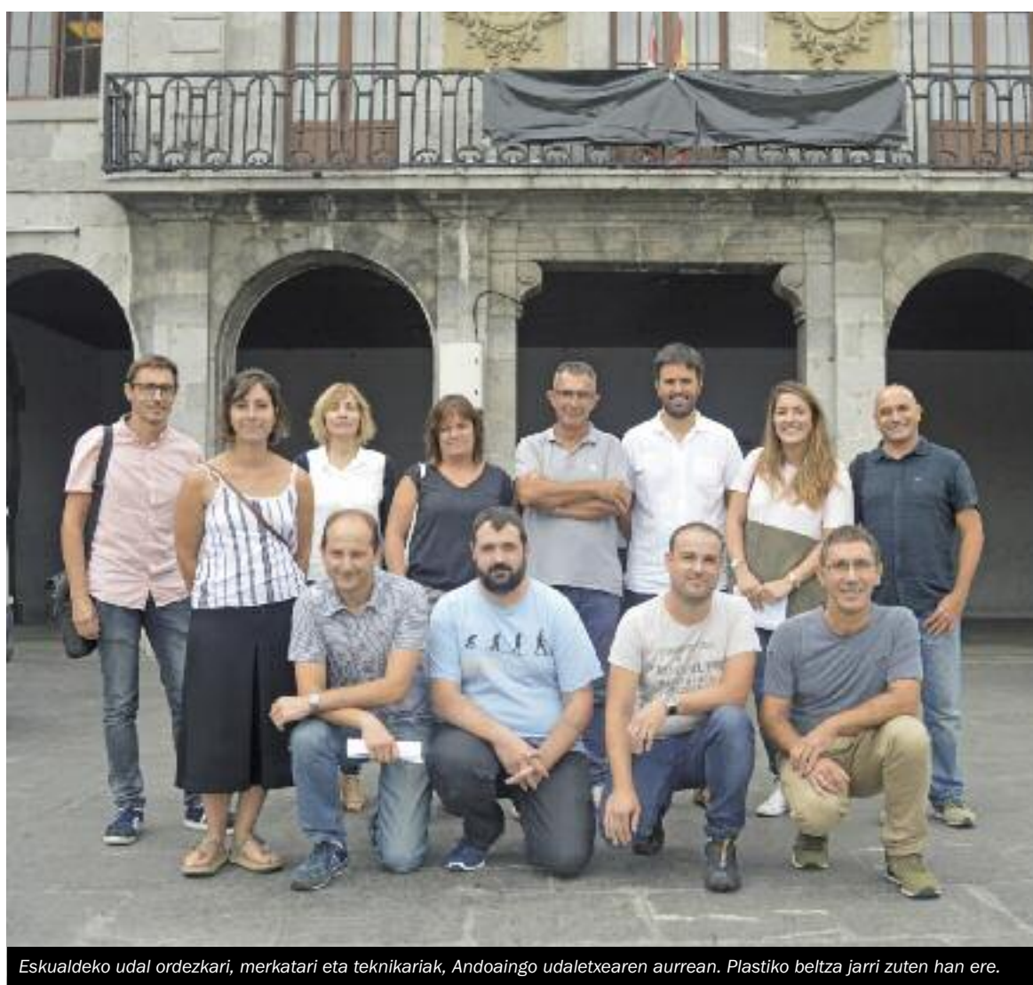
Eskualdeko udal ordezkari, merkataria eta teknikariak, Andoaingo udaletxearen aurrean. Plastiko beltza jarri zuten han ere.

Alaitasun eta bizitasun hori bera da, Hernaniko komertzio-