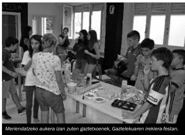
Meriendatzeko aukera izan zuten gaztetxoek, Gaztelekuaren irekiera-festan.