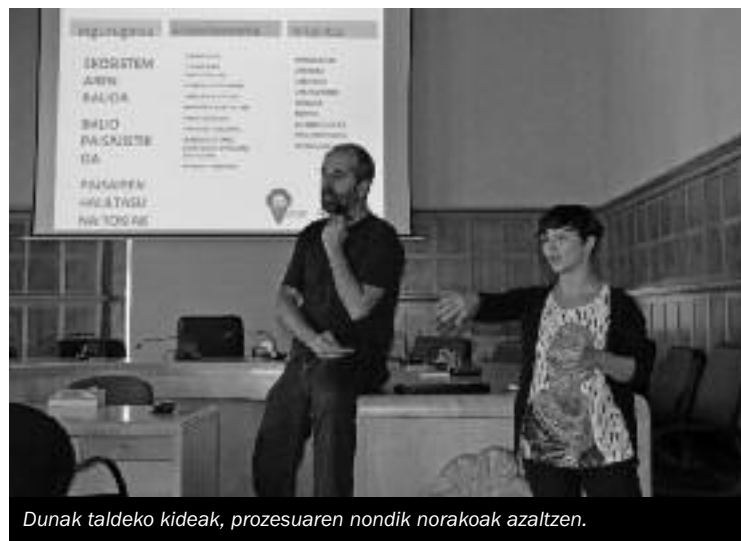
Dunak taldeko kideak, prozesuaren nondik norakoak azaltzen.

Eta lanketa hori eginda, oraingo kokalekua ikusi dute ondoen; baina beste tokiek eskaintzen dituzten aukerak ere aprobetxatzea proposatu dute: «kokapen bakoitzak ezaguri zehatzak ditu, eta aukera ezberdinak eskaintzen ditu. Sagardi gaina aberatsa da ingurugiro aldetik, eta egungo sagardiaren gaineko basoan, kupelak egiteko zuhaitzak daude; ibilbide bat egin liteke bertan. Hilerri ingurutik, berriz, Astigarragako sagardoaren paisaia osoa ikusi daiteke; toki ederra behatoki bat jartzeko. Portutxon, bidegorriaren eta ibaiaren gertutasuna, errepideetatik duen ikusgarritasuna eta sagardotegien gertutasuna aprobetxatu daitezke. Eta Ibai parkean jarri daiteke, adibidez, sagardoaren ibai bi-