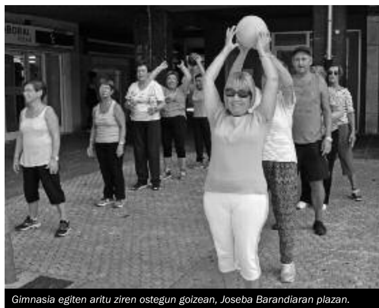
Gimnasia egiten aritu ziren ostegun goizean, Joseba Barandiaran plazan.

Elkartuko kideek, hitzaldia eskainiko dute, Herri Eskolako areto nagusian, arratsaldeko 17:00etan hasita. ||