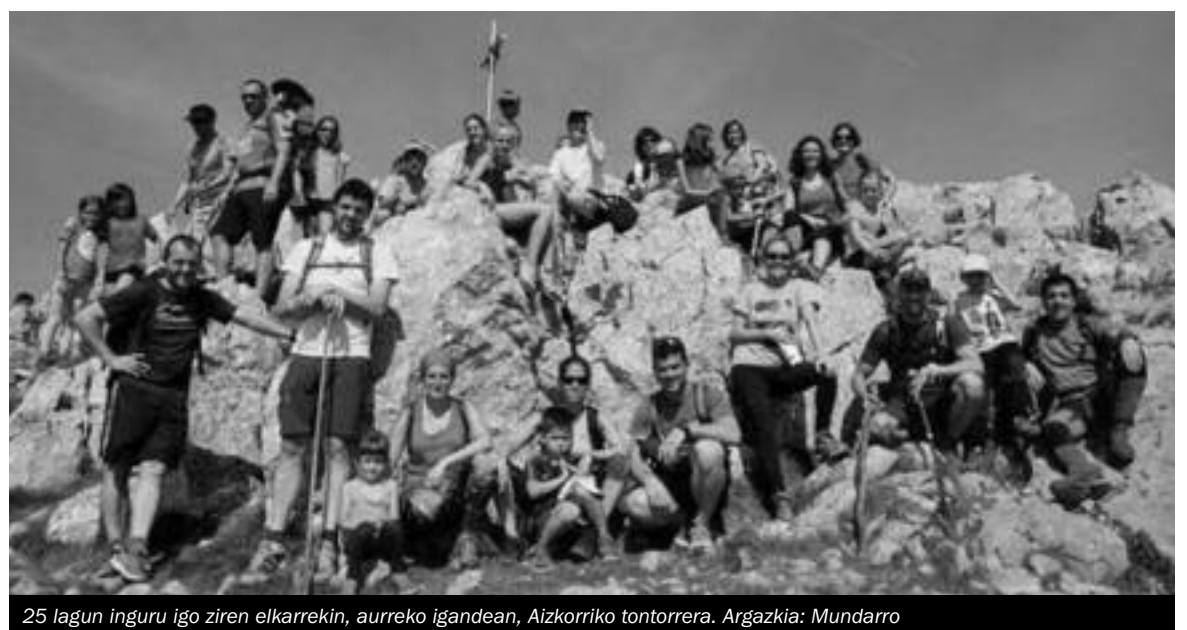
25 lagun inguru igo ziren elkarrekin, aurreko igandean, Aizkorriko tontorrera.

Eguraldi ederra lagun eta umore onean, gustora igo ziren Aizkorriara, bertan atera zuten taldeko argazkiak erakusten duen bezala. Ziur ez dela izango, ikasturte honetako azkeneko irteera! ■