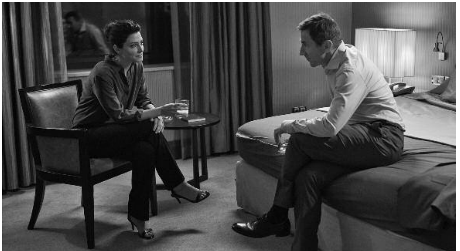
'El reino' izeneko thriller politikoa aurkeztuko du Rodrigo Sorogoyen zinegileak, Zinemaldiko Sail Ofizialean.

Rodrigo Sorogoyen zinegilearen pelikula berriak thriller politiko bat ekarriko digu Sail Ofizialera. Manuel ustelkeria kasu batean sartuta dago, eta bere alderdi politikoaren babesik gabe geratu da. Protagonista bere egoerari aurre egiten ikusiko dugu filmean. Aktore protagonista Antonio de la Torre da, eta berarekin Barbara Lennie aktorea ere ikusiko dugu. Ez da lehenengo aldia, Sorogo-