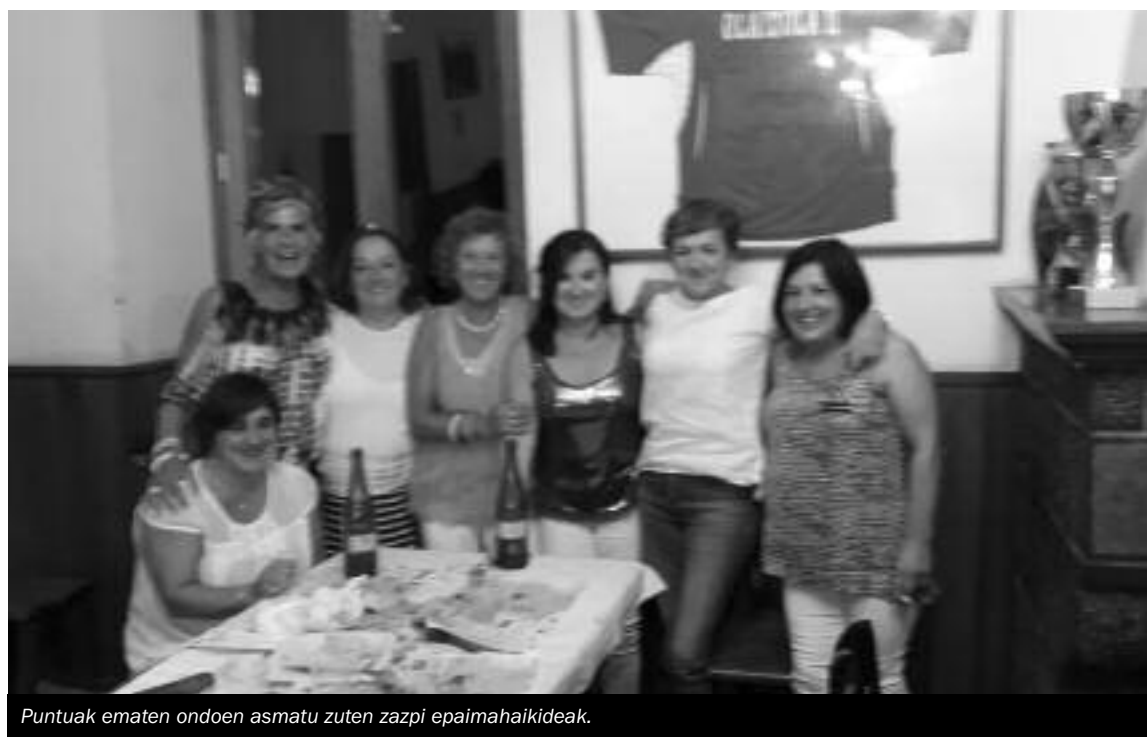
Puntuak ematen ondoen asmatu zuten zazpi epaimahaikideak.

Lan bila nabil pasteleri edo gasolindegiko arloan. Langilea, arduratsua eta euskalduna. Deitu: 636 506 182