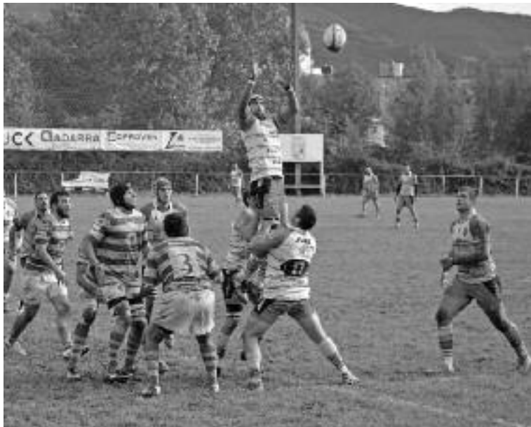
Joan den urtean ere, Cisnerosen kontra estreinatu zen Hernani, Landaren.

Iazkoa ez errepikatzea Partidu garrantzitsua izango da gaurkoa, azterketa serioa, ikus-