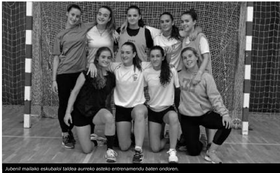
Jubenil mailako eskubaloiko taldea aurreko asteko entrenamendu baten ondoren.

goria berria dela guretzat, eta bertan txikienak izango gara. Jarraitu behar dugu ikasten, izan ere, kategoria honetan eskubaloia aldatu egiten da. Aurtengo helburua da partiduak borrokatzen jarraitzea