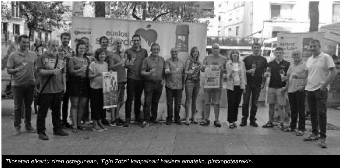
Tilosean elkartu ziren ostegunean, 'Egin Zotz!' kanpainari hasiera emateko, pintxopotearekin.