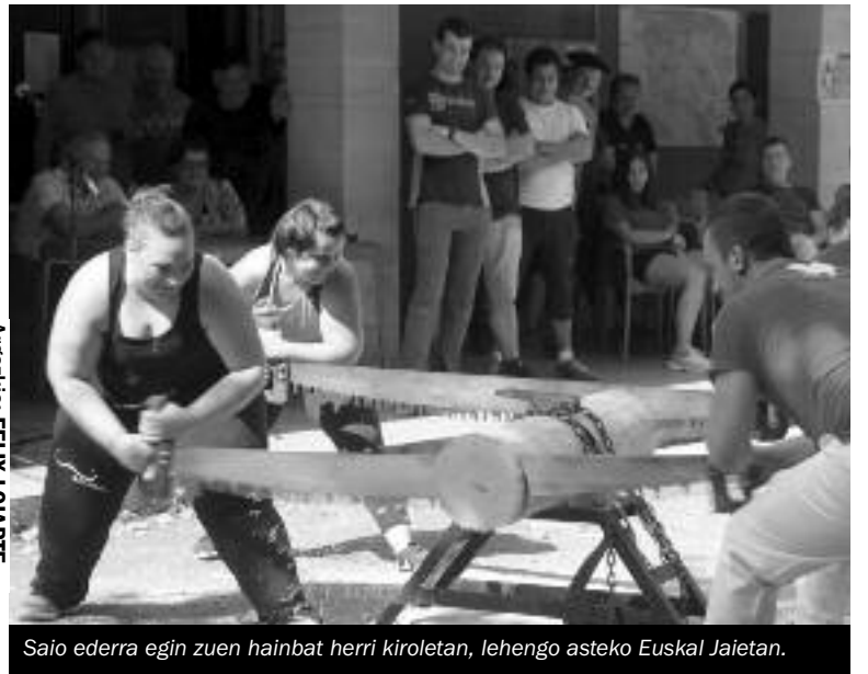
Saio ederra egin zuen hainbat herri kiroletan, lehengo asteko Euskal Jaietan.

Kanpotarrentzat oasi, bertakoentzat aisialdi gune Hain zuzen, makina bat ekin-tza antolatu dituzte Iskibi kanpiñean azken urteetan, eta goizuetarrek ere gozatu dute.