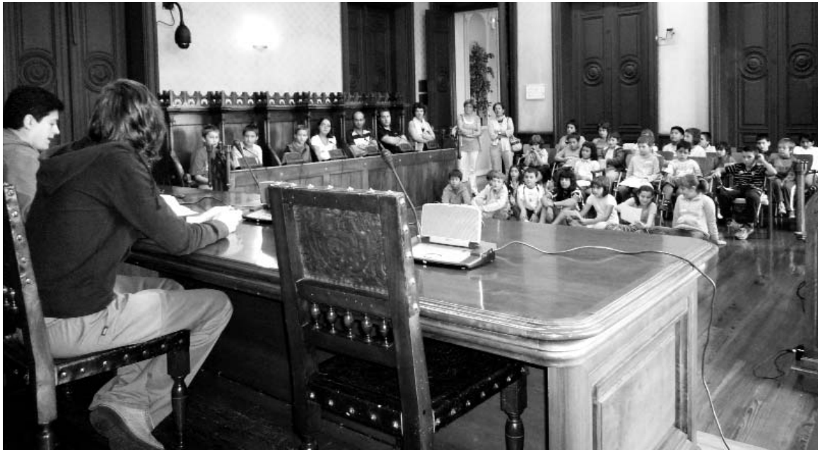
Mugikortasun Astearen barruan ikasleekin egin zen pleno berezia.

BIHAR San Miguel egunean udako eguraldia izango da. Temperatura atsegina eta hego haizea. Arratsaldean lainoak agertuko dira baina ez du euririk egingo. (euskalmet)