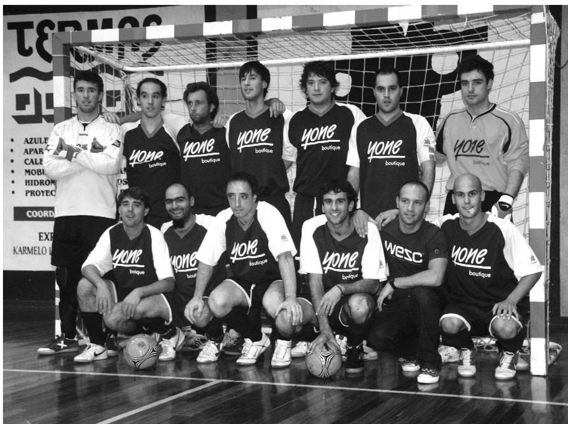
Yone Boutique taldeak primeran hasi du denboraldia.

Oso bestelakoa izan zen bigarren zatia. Mutilak konzentrazio haundiarekin atzera ziren pista eta kanpokoan gaintetik pasa ziren, 3 gol lortuz. Atzekaldean hutsik egin gabe ibili ziren bigarren zati osoan, hortaz azken