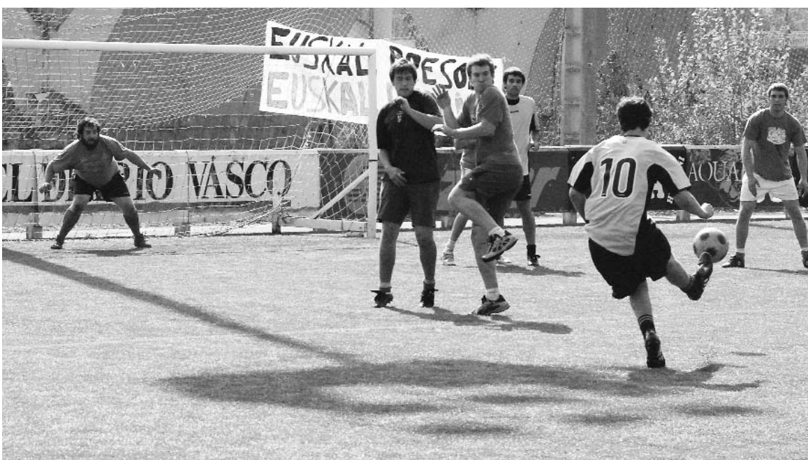
Goiz eta arratsalde partiduak jokatu ziren atzo Zubipen.