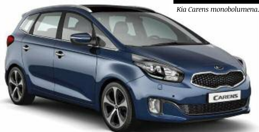
Kia Carens monobolumena.