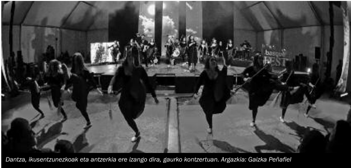
Dantza, ikusentzunezkoak eta antzerkia ere izango dira, gaurko kontzertuan.