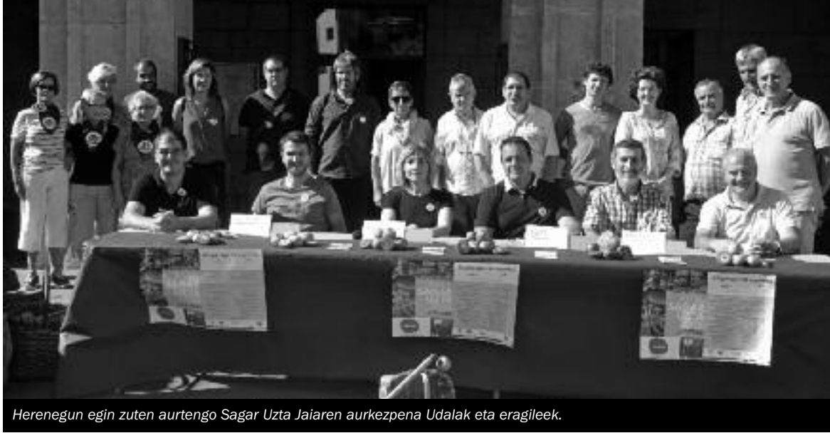
Herenegun egin zuten aurtengo Sagar Uzta Jaiaaren aurkezpena Udalak eta eragileek.