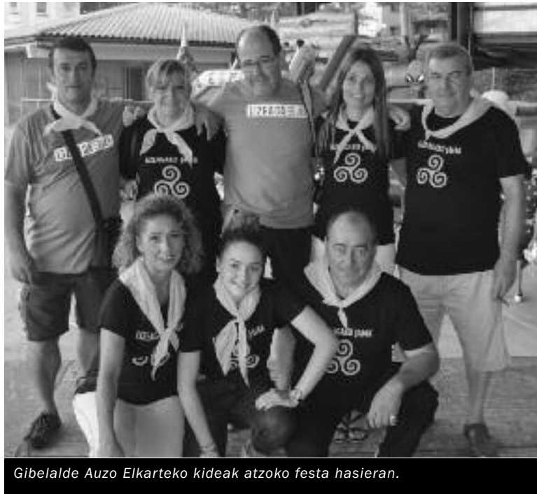
Gibelalde Auzo Elkarteko kideak atzoko festa hasieran.

Gibelalde da Lizeagako Auzo Elkarte, bihar arteko jaiak antolatzen dituen, besteak beste. Auzoa eraberritzeko lanean dihardu, baita ere, nahiz eta zailtasunak dituela onartu: «Hernaniko auzo ahaztua da, 'vintage' auzoa».