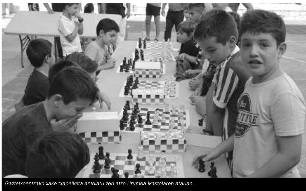
Gaztetxoentzako xake txapelketa antolatu zen atzo Urumea ikastolaren atarian.

Tortilla lehiaketa eta sagardo dastaketa, bihar Omenaldi batekin hasiko dute biharko eguna, Sandiusterrin adinekoei egingo dietena. Eta