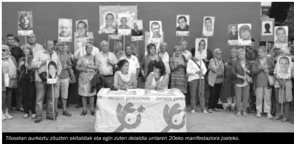
Tilosetan aurkeztu zituzten ekitaldiak eta egin zuten deialdia urriaren 20eko manifestaziora joateko.