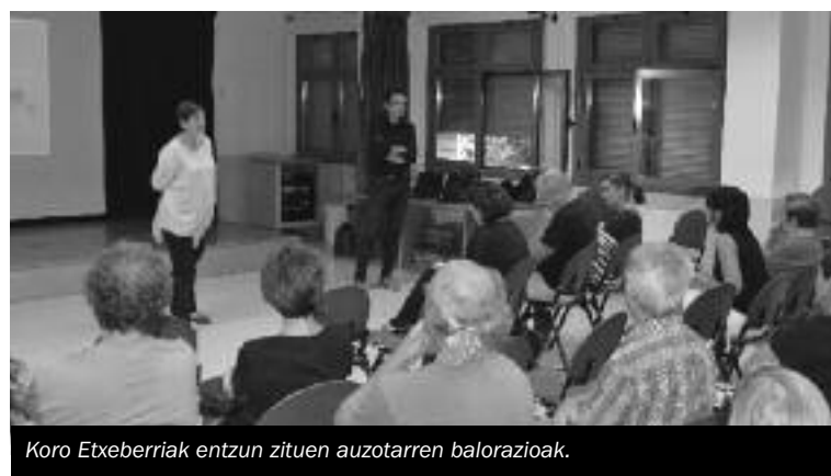
Koro Etxeberriak entzun zituen auzotarren balorazioak.