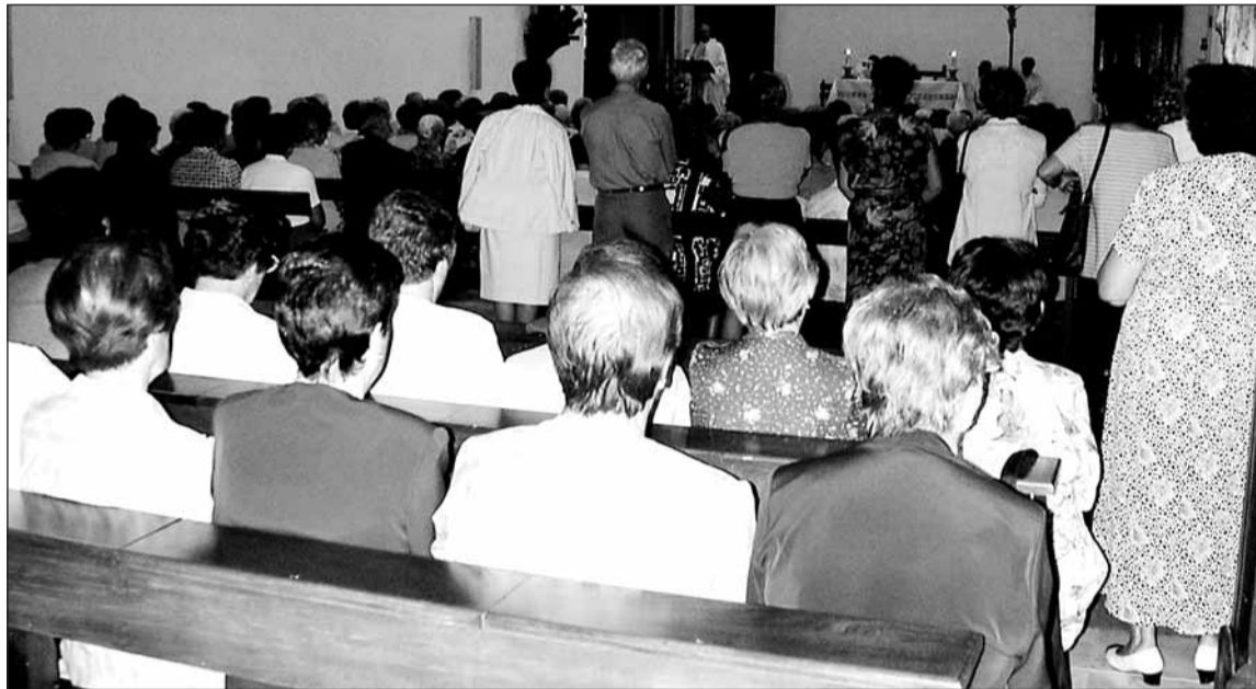
Herritarrak mezetan. Lurdesen ere izango dute ordubietako meza entzuteko aukera.