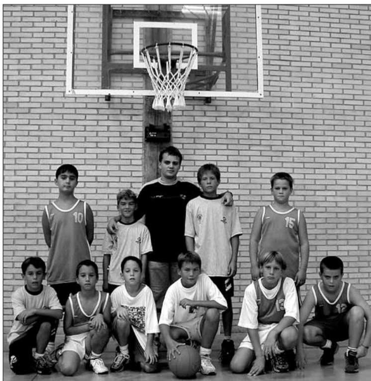
Hernaniko saskibaloilari gazteak (txuriz) katalanekin batera.

Gaur partidu gehiago goizeko 11:00etan hasita. □