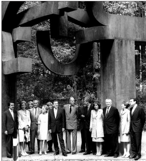
Txillida-Lekun, atzo: ia denak elkarrekin.

Guztira, 1300 gonbidatu ziren inaugurazioan, arte munduko izen haundiak barne.