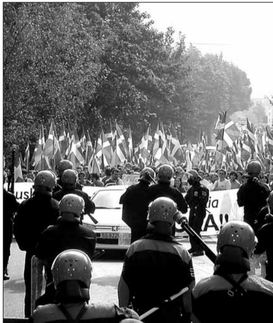
Ertzain eta manifestariak Cuesta de la Muerten.

GOIZETIK Zabala inguru osoa hartu zuten atzo polizia indarrek. Errekaldeko bidea itxita eta airean bi elikoptero etengabean bueltaka. Hamabiak eta bostean iritsi dira Zabalagara airez Juan Carlos I eta Sofia. Justu orduan, Ertzaintzak Mecar motako sei granada aurkitu zituen inguruko baso batean (ez zuten zehaztu zein basotan). Ez dute, ordea, gauza garbirik zabaldu. Hasieran, deto-