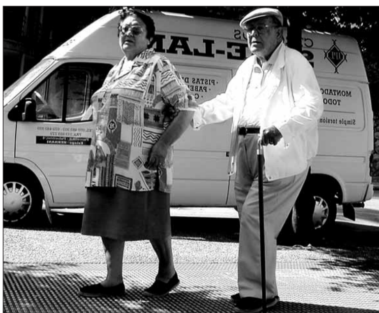
Gizon-emakumeak Urbieta kalean paseatzen.

Hasieran, autobusa goizeko zortzietan izatekoa bazen ere, azkenean zazpizetan aterako da Atsegindegitik. □