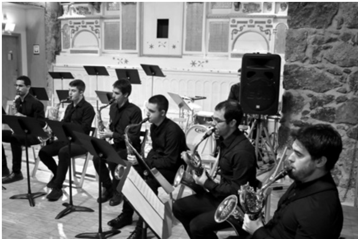
Aurreko ostiralean Hernasax taldeak, kontzertua eman zuen Milagrosan.

Santo Tomas eguna, oraindik ospatzeko Etzi, Santo Tomas eguna ospatuko da Urumea bailarako bi eremutan, Ereñotzun eta Hernanin, hain zuzen ere. Ereñotzuko Santo Tomas festa Txirrita ikastolan ospatuko dute, eta 11:30etarako prest izango di-