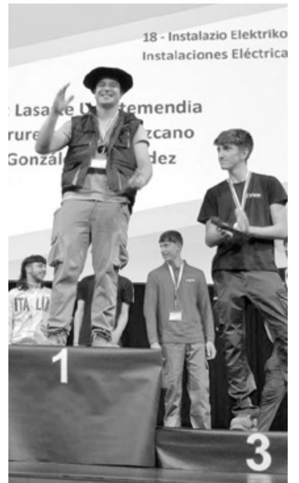
Podiumean lehenengoa. Eusko Skill