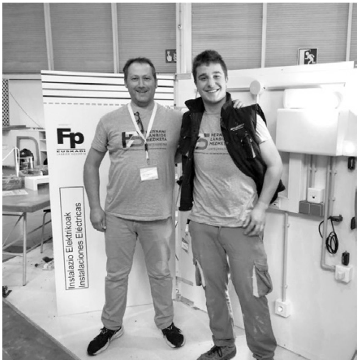
Irakaslea eta erakusketarako montaiia