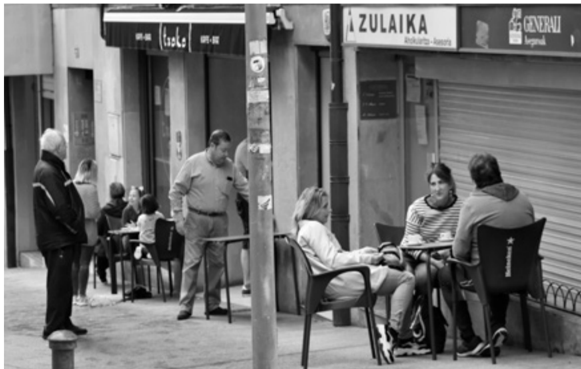
Bezeroak tabernako terrazan, pandemia garaian.

Sentsibilizazio kanpainaren bitartez, hiru lurraldeetako ostalaritza elkarteek bere hondar alea jarri nahi dute pandemia indargabetzeko. Azken hilabeteak gogorrik ari dira izaten herritar guztientzat, eta hori dela