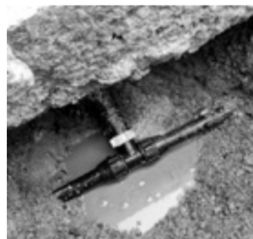
Ur fugak detektatu dira, Goizuetan,

Ur-ihesak guztiekin egunean 199.000 litro ur galtzen dira la hiru asteetan ura moztu zen herrian, auzo bakoitzean zenbat ur kontsumitzen den jakiteko eta gero, gauez ura moztuta-