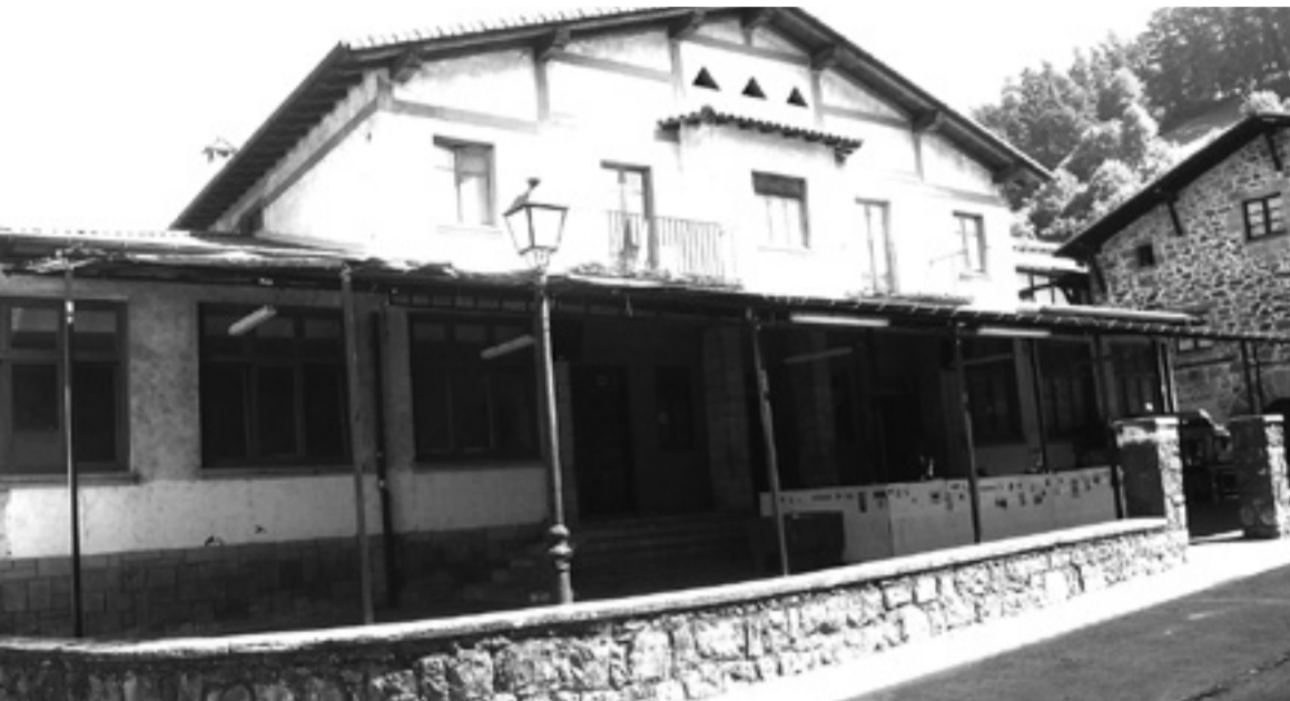
Toldoak aterpe lanak egingo ditu udaran zehar.