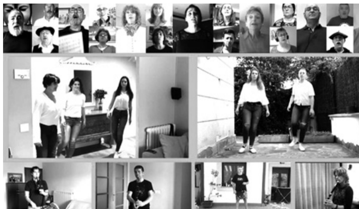
Bideo bidez eta telematikoki egin da Zaharren Omenaldia.

Estaliaren muntaia larunbatean, ekainaren 20an egingen da, goizeko 08:30etan, eta herritar guztiak gonbidatuta daude bertara, denen artean lan xamurragoa izanen baita. K