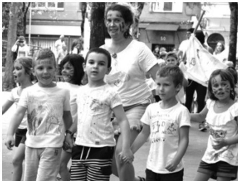
Pasa den urteko udaleku irekiak Plaza Berrin.

«Udaldian ekintza anitzak eskaintzea inoiz baino beharrezkoagoa dela defendatzen dugu, haur eta nerabeek herriarekin harremana berreskuratzeko», azaldu du, eta beraz, irizpideak argitaratu ditu, ekintza eskaintza anitza osatzeko, «aisialdi zein elkartegintzan adituak eta arituak diren herritar eta profesionalekin batera eratuak izan beharko dutenak». Horren aurretik, beldurretik elkar zaintzara pasatzeko mezu posi-