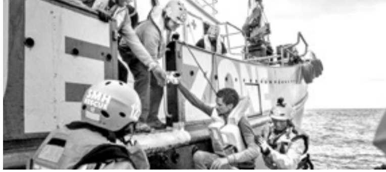
Aita Mari dokumentalaren irudi bat.

Lehen aipatutako jarduerekin batera "Aita Mari" dokumentala ikusi genuen eta hau hiru zatitan banatzen da: itsasontziaren aurkezpena, Estatuak ezarritako blokeoa eta erreskatea. Salbamento Maritimo Humanitario-ko bi kideek ezohiko ideia bat izan zuten, arrantza-ontzi bat erreskate ontzi bihurtzea, Mediterraneo itsasoan itozten diren errefuxiatuak salbatzeko. Horrela sortu zen Aita Mari proiektua. Langileen eta boluntarioen laguntza ezinbestekoa