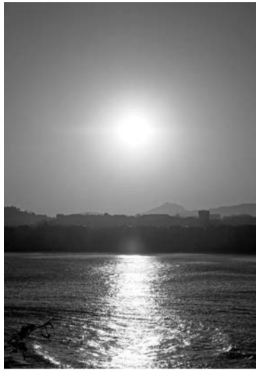
Egilea: Uxue Zugasti Rodríguez

2004an Hernanin sortutako kulturartekotasun elkartea da.