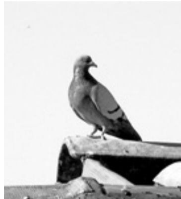
Egilea: Uxue Zugasti Rodríguez

«Eta zu, hainbeste aldiz aipatua, nor zaren pentsatzen ariko zara. Zu agian polizia zara, komisaria bateko mahai batean nire asiloaz erabakitzen ari dena.