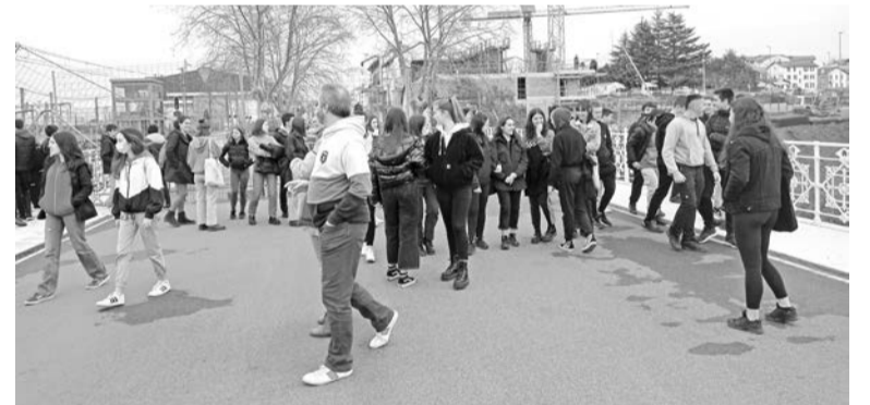
Hernani BHIko ikasleak Irun eta Hendaia arteko mugan.

Jarraian, Irungo udaletxea dagoen San Juan plazara jo genuen. Bertan, migranteei egiten zaien harrera bilera bertan izaten zela aipatu ziguten. Bileran migranteei momentuan dituzten eskubideak eta aukerak aurkezten zaizkie, bakoitzak bere erabakia har dezan. Batzuek espainiar estatuan asiloa eskatzea nahiago dute; beste batzuek, ordea, argi dute frantziar muga zeharkatu nahi dutela beraien bidaiaren aurrera jarraitzeko. Pertsona zuria izanda, zubi bat gurutzatzea besterik ez da; pertsona beltzek, aldiz, beste metodo batzuk erabili behar dituzte polizia frantsesaren jarrera zorrotzari eta arrazistari aurre egiteko. Horietako bat, pertsona bati laguntza eskatzea, eta honekin autoz gurutzatzea izaten da, kasu honetan ehunka euro ordaindu behar dute, eta modu ilegal batean egiten da. Beste bat, ibaia gurutzatzea da, hemen arrisku handia dago, askok ez dakitelako igeri egiten. 2021. urtean, 7 pertsona hil ziren