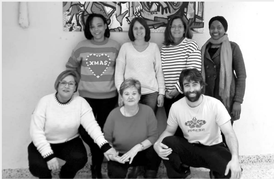
Egileak: Hernaniko AEKko ikasleak