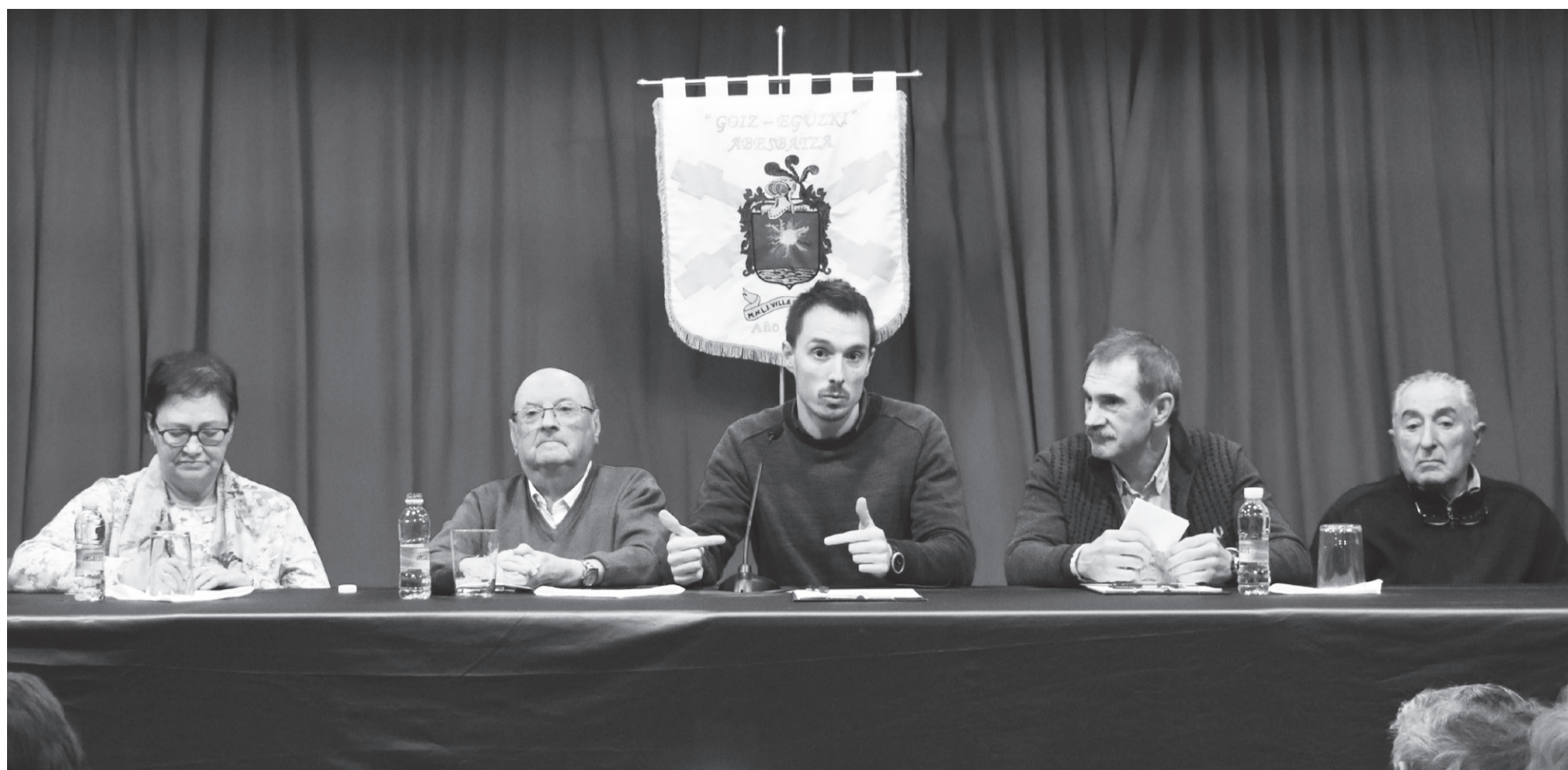
Atzo Asanblada egin zuten Goiz Eguzkin, bertako zuzendaritza eta Udaleko kideekin.