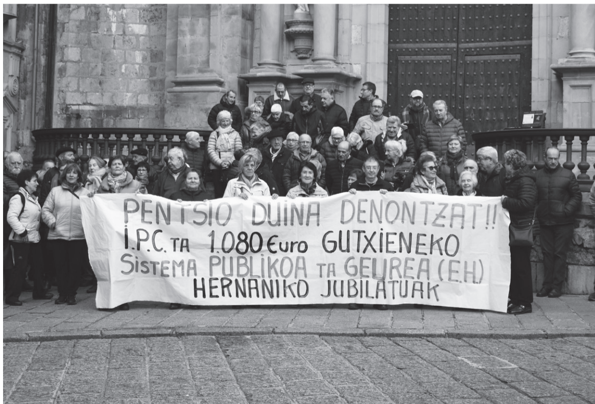
Atzo, urteko lehen konzentrazioa egin zuten Pentsiodunek.