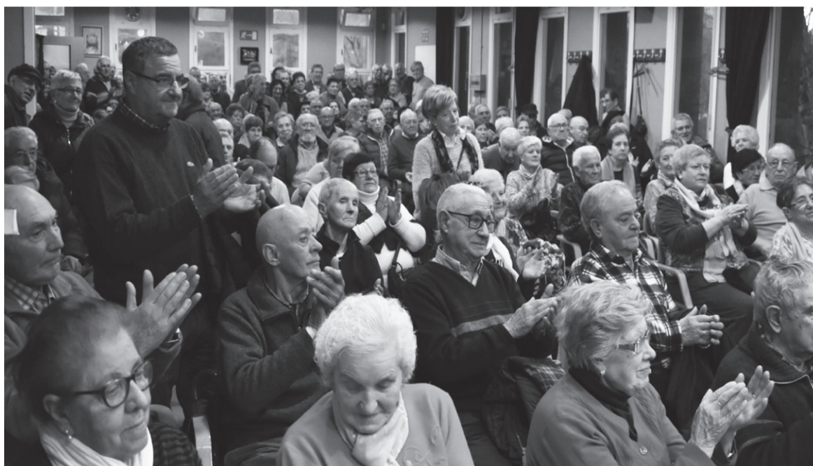
Asko izan ziren atzoko Asanbladara gerturatu zirenak.

Goyak galdera bat botatu zuen; Mapatik desagertzeko prest gauden? Bertako guztiek ezetz erantzun zuten. Eta ondoren beste galdera batekin jarraitu zuen; Zein dago prest Goiz Eguzkiko egoitzan kolaboratzeko? Eta hor hartu zuten denek lasaitua, zazpi bat pertsonak altsatu baizuten eskua. «Asko poztan naiz, honek jarraituko duelako» erantzun zuen Goyak, honakoa gaineratuz, «14 urte hauetan