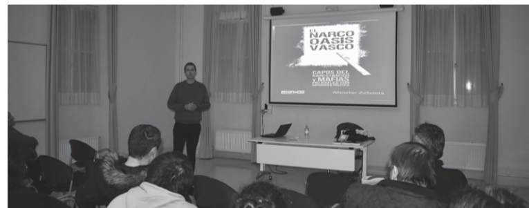
Atzo, Ahoztar Zelaietak egindako liburu aurkezpenean.

eta harremanetarako helbide elektronikoa jarri dute eskura, iradokizunak egin edo ideiak partekatuzko: 2020mpeh@gmail.com .