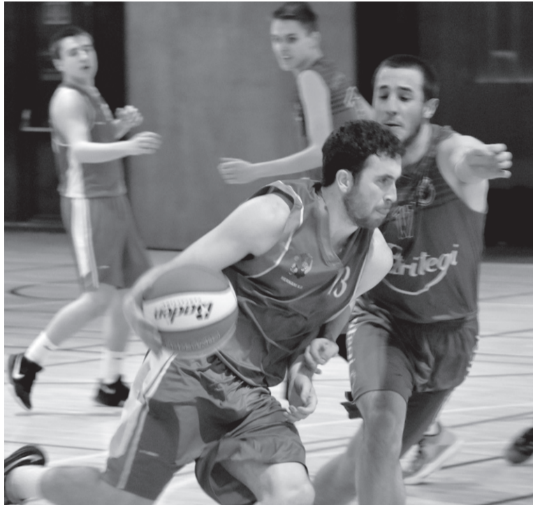
Aurea hartu zuen Hernanik, azken laurdenean.

Hirugarren eta laugarren laurdenetan ere dantzan jarri zuten markagailua, jokalariek. Berrito ere Mundarro aurreratu zen, hasieran. Baina azken laurdenean erabaki zen partidua, eta bost tantoko aldearekin, Herna-