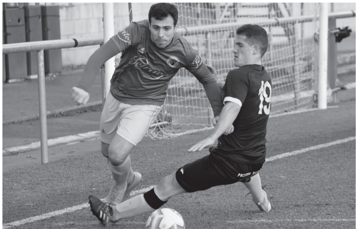
Rotetaren aurrean bana berdinduta, hurrengo arierio gogorraren aurrean aritzeko kemena bildu du Mundarrok.

Hernanik, bestalde, txukun jokatu zuen Anaitasunaren aur-