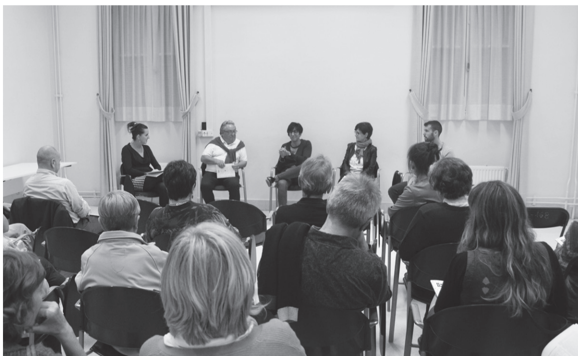
2018an zehar Euskara Ari Duk gauzatutako erronkez betetako, Baietz Hernanik! liburuaren aurkezpena.

nondik datorren eta Euskara Ari Du taldea nola sortu zuten ere azalduko dute. Elkarrekin kontaktua egingo dute urte honetan zehar, eta guztion artean Euskaraldia egitasmoa prestatzea izango dute helburu nagusi bat. Euskara Ari Du taldekoek azpimarratu dute, «asteko eta hiru hilabeteko erronkak ere izango dira, aurten ere». Hau guztia, gaurko aurkezpenaren entzuteko aukera egongo da. K