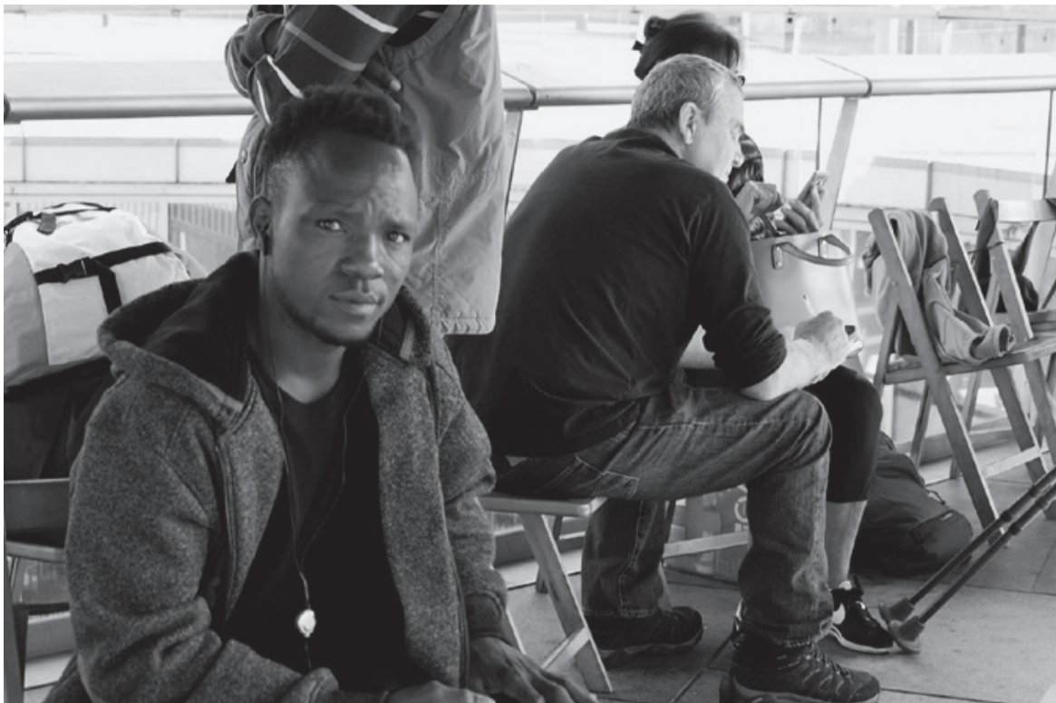
'Paseko txoriak', filmeko eszena bat.