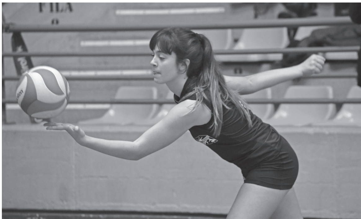
Neska kadeteen taldeko jokalaririk bat, saka egiteko prest, larunbatean Hernaniko kiroldegian.