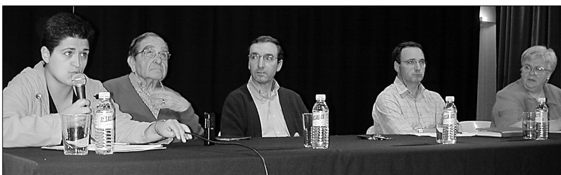
Aurkezlea eta lau Alkateak mahai inguruan, Biteri kultur etxean.