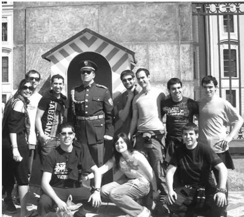
Praktikak egiteaz gain, bazter berriak ezagutzeko aukera izaten da.