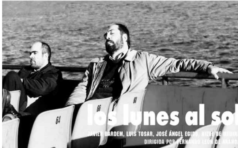
'Los lunes al sol' pelikularen karteal

Estreinaldia Espainian: 2002ko irailaren 27an.