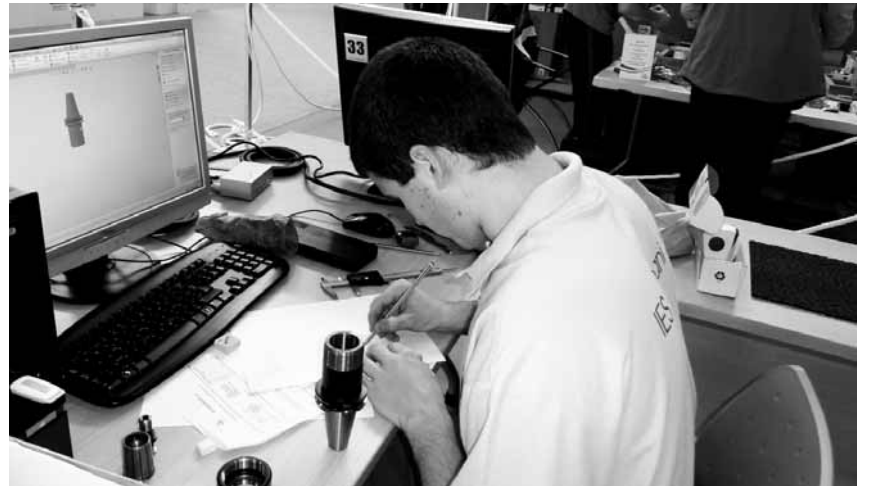
Iurgi Los Arcos lehiaketan parte hartzen.

Etxera itzultzean, familiakoek edo lagunek lehiaketaren inguruan galdetzerakoan, honako hau izaten zen nire erantzuna: «Oso esperientzia ona izan da, astebete gehiago geratuko nintzateke». Eta halaxe da, bizipen polita baina motza izan da. Inongo zalantzarik gabe, errepikatuko nuke, baina adinak asko