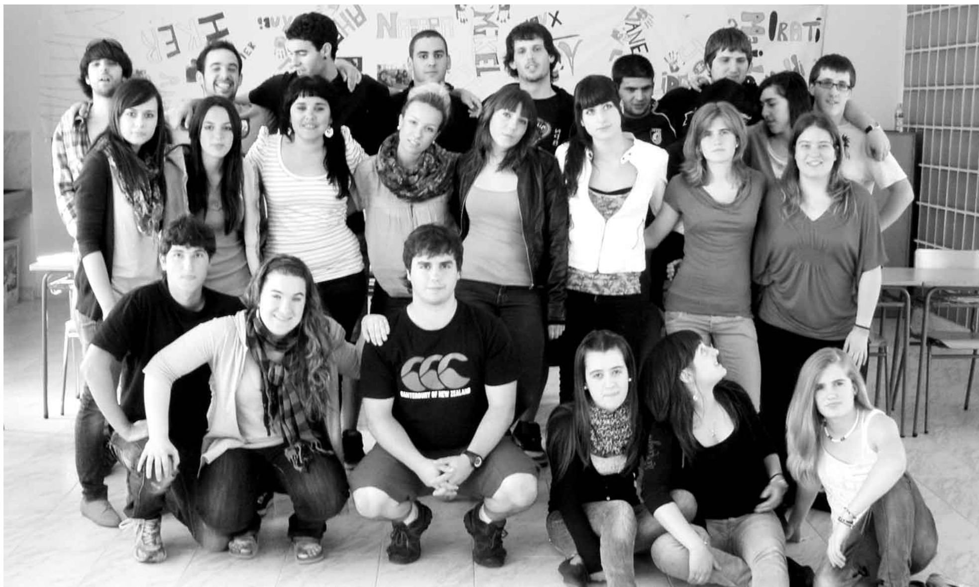
Animazio soziokulturaleko ikasleak.