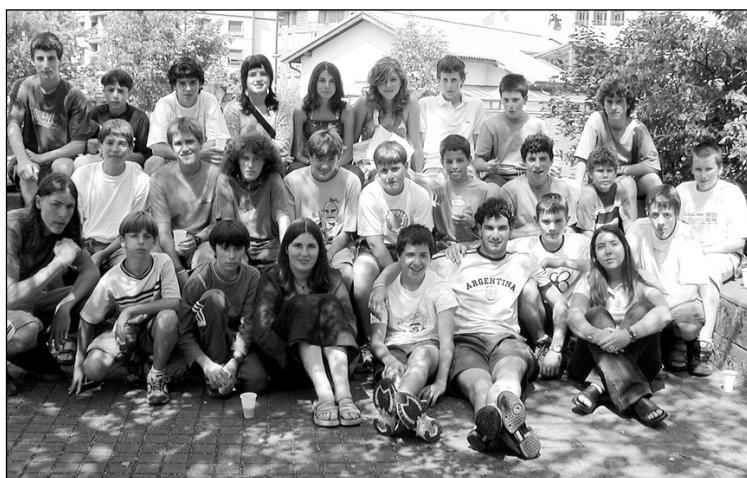
Uda Gaztea Udalekuetan ibilitako talde bat, aurreko urtean.

Ekintza gehienak egun bakarrekoak izango badira ere, egun pare bateko ateha ere prestatua dute Kale Hezitzaileek, gaua kanpoan pasatuaz. Ekintza bakoitza noiz eta nola izena ematen dutenekin zehaztuko da. Izena emateko lekua: Sandiusterrri behea. Telf: 943-557790 edo 655720443 (16:30etatik 17:30etara, Mainer edo Ikerren galdera egin).