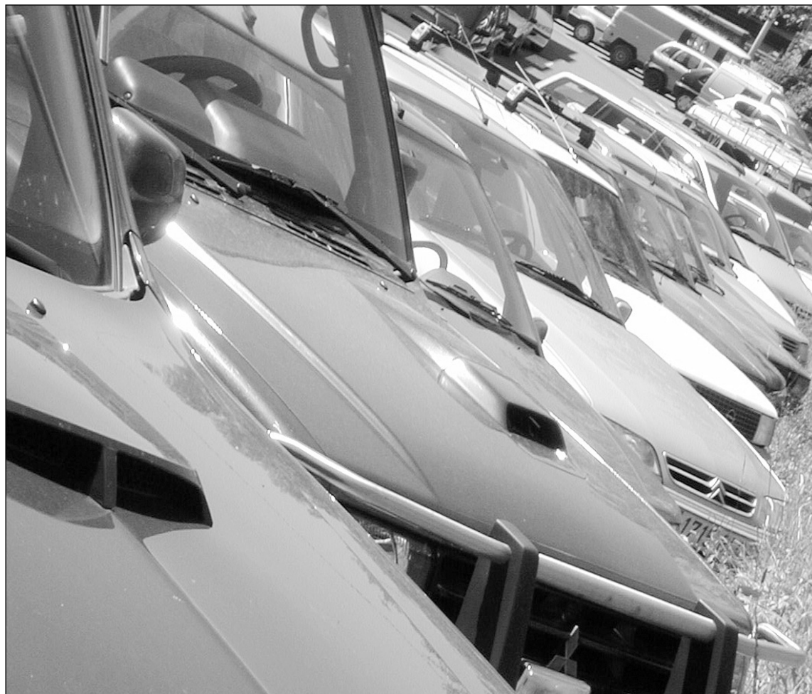
Hernanin orain dela 4 urte baino 1.500 kotxe gehiago daude.

Hernanin bost kontzesionario daude eta berak esan digutenez, gehien saltzen den modeloa tamaina-erdikoa da, nahiz eta, txikiak ere estimazio handia