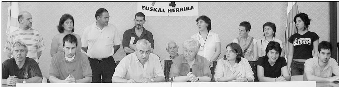
Bildu Hernanik plataformak ostegun arratsaldean emandako prentsurrekoa.

“Dagokigun ordezkartza” Aurrera begira, Bildu Hernanik beste alderdiekin bilerak hasteko asmoa du: “Herri honetako lehen indar poli-