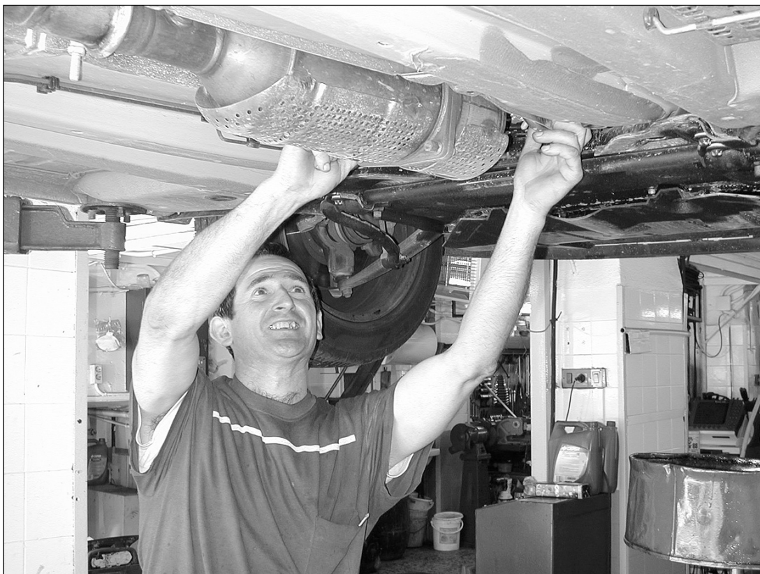
Jendeak normalean errebisioa egitera eramaten du kotxea tailerrera.

Dena dela, karrozeriek edo tailerrek konpondu ezin duten kasuetan, kotxea trafikotik erretiratu eta desguazera eramaten da. Desguazean kotxeari deskontaminazioa egiten zaio (bateria eta olioak kendu) eta piezak salmentan jartzen dira txukun-txukun apartatuta. Desguazean kotxearen zati guztiak erosi daitezke, seguritate arriskua izan dezaketenak kenduta (frenu pastilak, errotoak...). Hernanin desguaze bakarra dago eta herriko tailer gehienekin dauka harremana. □