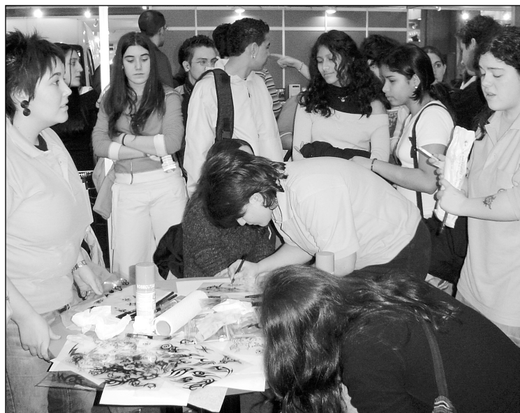
Tatuajeak egiten Bilboko erakustazokako gunean.