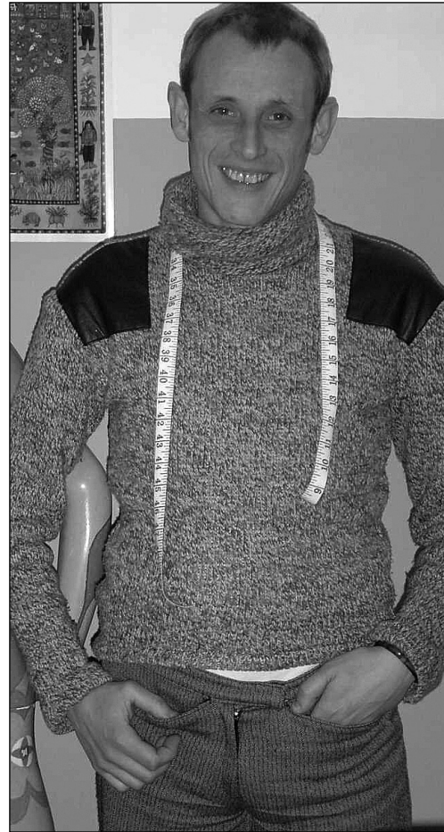
Kabuki, Zikuzuloko lokalean.

Non daukazu zeure tailerra? Lehenago arazoak nituen loka-