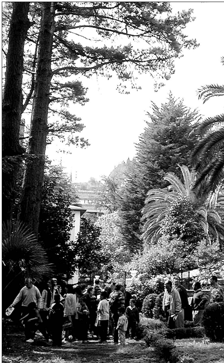
Nere Borda parkean bisita gidatua.

Parkearen bigarren zatia lora-tegi klasikoa deitzen zaio, eta hirugarren zatia gune didaktikoa, hemen ikasleak landareak landatzeko gunea dute. □