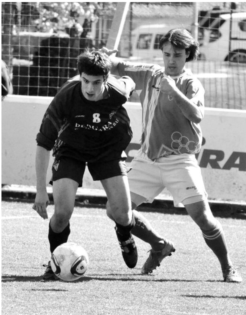
Hernanik Real Union, Urola eta Berio izango ditu aurkari, datozen asteetan.