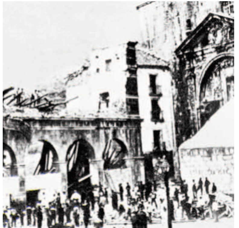
Hernaniko Udaletxea eta eliza.