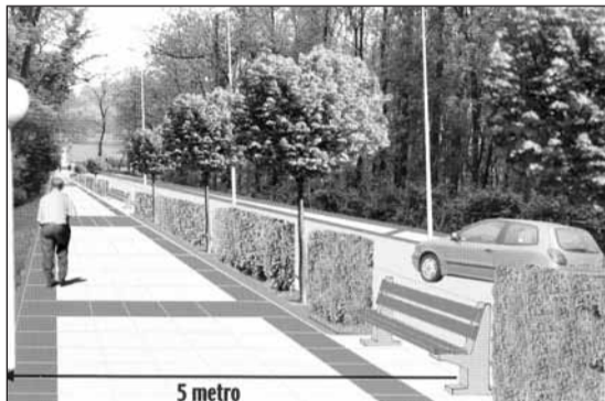
Ezkerrean, oraingo pasealekua. Eskubian goian, plano orokorra; behean, nola geldituko den.