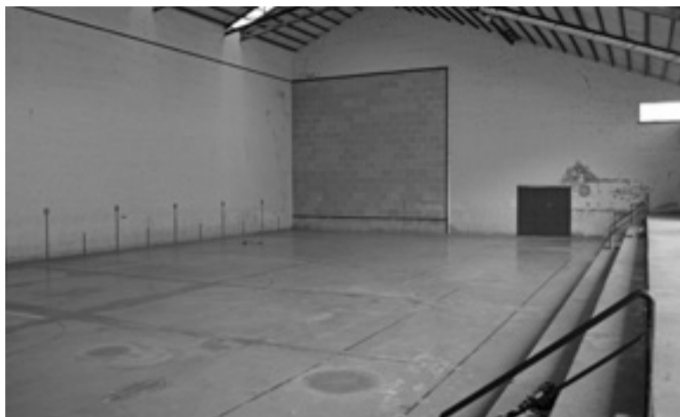
Xalto eskolako frontoia zabaldu du Goizuetako Udalak, berriro.

Egunean ordubete, gehienez Kirolari bakoitzak, egunean ordubetez aritu ahal izanen du