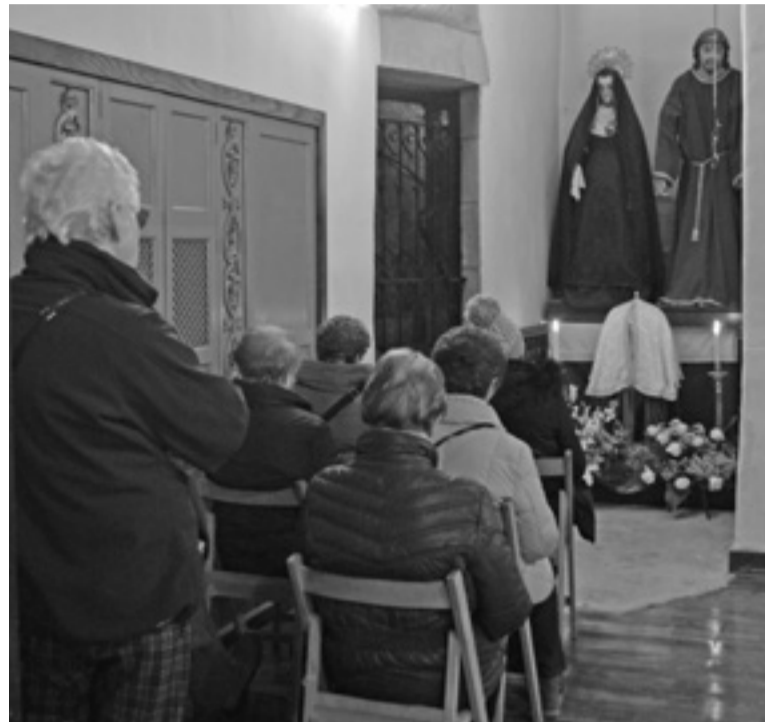
Gaur hasiko dira igandetako mezak berriro, Astigarragako elizan ere.

Aranoko elizan, ordea, oraingoz ez da elizkizunik izango, ez astegunetan eta ez igandean. K