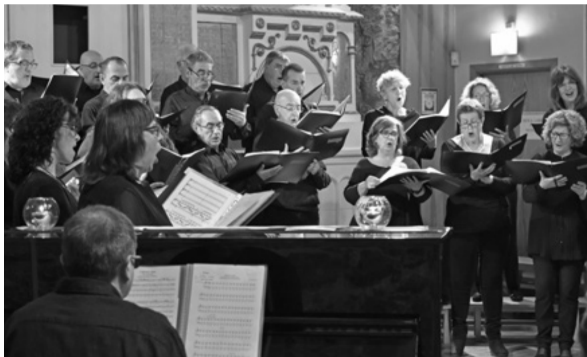
Kantuz abesbatzako kideak, joan den urteko Kantuz Eguneko kontzertuan, Milagrosako kaperan.

Osasun alarma egoera honetan, bideoa ikustera gonbidatu dituzte herritar guztiak: «espero dugu bideoaz gozatzea». Aukera aprobetxatu nahi izan dute, gainera, abesbatzako bazkideei eskerrak emateko, «zuen laguntza eta babesagatik»; eta baita hernaniar guztiei ere. K