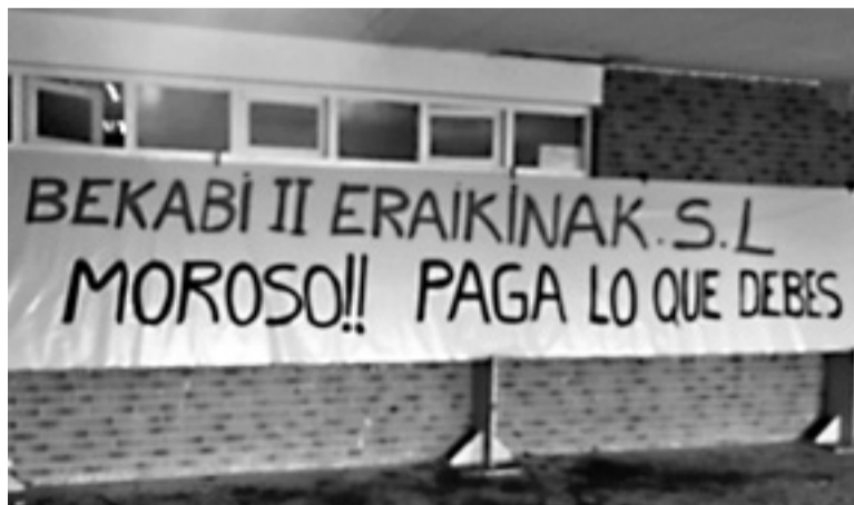
Soldatak zor zaizkiela diote langileek.

Fatxadak edota etxebizitzak berritzen lan egiten duen Bekabi II enpresak hainbat soldata zor dizkiela langileak.