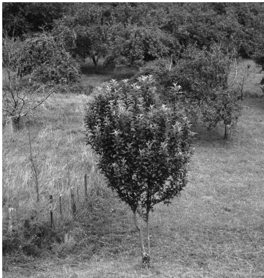
Urumea ibaiertza izango da toki kaltetuenetako bat.

Hernanin, bada Abiadura Handiko Trenaren aurka egiteko bildu eta ekintzak gauzatzen dituen talde bat. Hauek, AHTaz gain, beste makroproiektuen aurka ere egiten dute, hala ere, momentu honetan trenari zuzenduak daude. Beraien lehen helburua, nolabait, herriko jendea, obra honek ekarriko dituen arazo eta kalteez kontzientziaztea da. Izan ere, taldekideen iritziz, askok oraindik ez dakite zehazki zer den, beraien herritik pasatzen den, zein eragin izango duen... Honela, trenak ekarriko dituen ondorioak jakinarazteko hainbat ekintza gauzatu dituzte 2007ko maiatza inguruan elkar-tu zirenetik. Horien artean, mendi martxa, manifestazioak, bideo emanaldiak... antolatu dituzte. ||