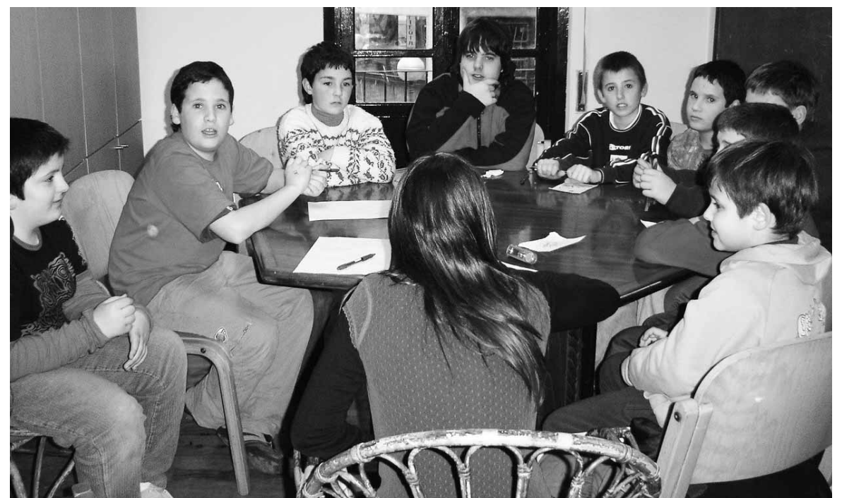
Hurrengo txapeldunak ikasten.

Lehenago eta oraingo idoloak Batzuk joaten dira bertsoak gustatzen zaizkielako eta beste