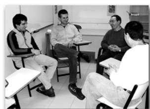
Mende laurden bat bertsoz bertso/ II