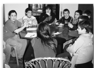
Bertso eskola: uzta berria eraiten/ II