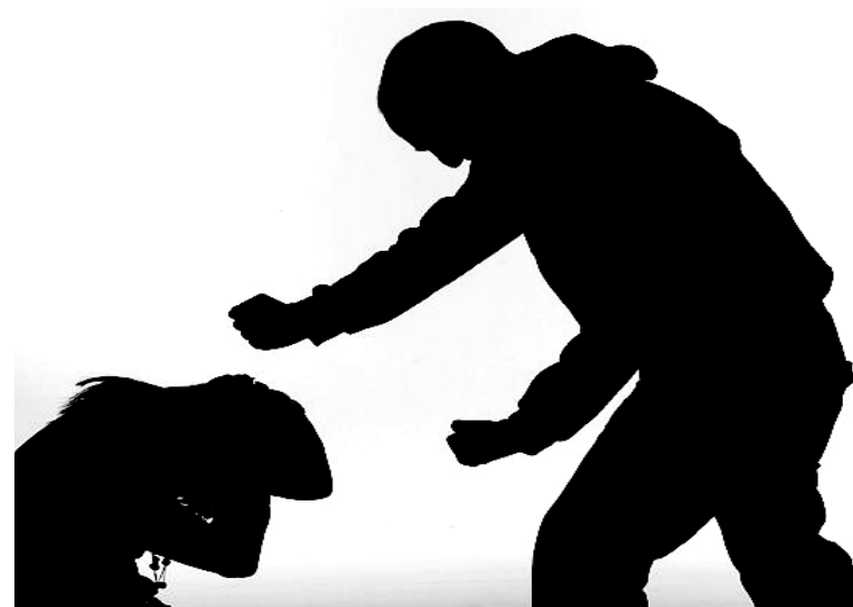
Lehen topaketa feminista Bogotan antolatu zen.

3- Emakume etorkinen eskubideak bermatzea eta ezagutzea; haien bizimodua oso gogorra da, guk egiten nahi ez ditugun lanak egiten baitituzte eta irabazten duten dirua, beren familiei bidali behar baitute. Aipatu bazterketa honez gain, kontratu legalik ez izatea ere pairatzen dute. Beraz, berdintasun plana ezarri behar da lantokietan; oraindik ikus daiteke emakumeek balore gutxi dutela eta gizonen, aldiz, lehentasuna dutela lan bat aurkitzeko momentuan. Enpresa batzuetan nahiz eta gizonen emakumeen lan berdina eduki, emakumeen soldata txikiagoa da.