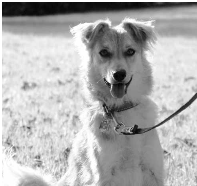
Xagi, Gorkaren txakurra.

Udane sorgina zen. Itxura zakarra eta mesfidatia zuen,