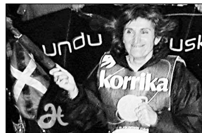
2001eko Korrika Hernanin barrena.

Bestalde, Sanjoanetako kartela egiteko lehiaketa ere zabalik dago. Informazio gehiago, Biterin. □