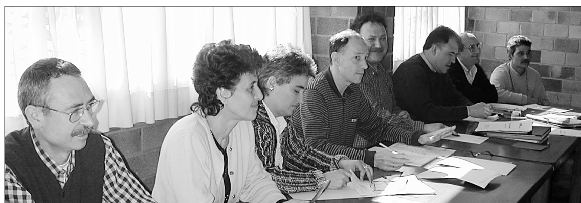
Karobi elkarteko zuzendaritzako kidea joan den igandeko batzarrean.

jende asko ibili litekeela eta arriskuak ebitatzeko hartu du Udalak neurri hori. Beraz, Elkano kaletik gora datorrenak Izipuzan behera jeitsi beharko du. □