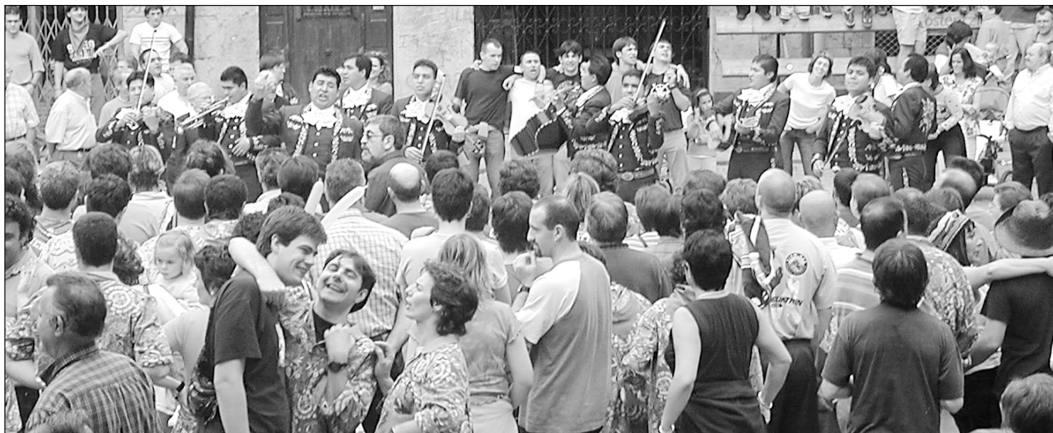
'Mariachi' taldeak Sanjoanetan Hernanin arrakasta handia izan zuen.