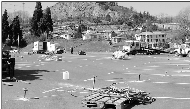
Txantxillan hasi dituzte karpa jartzeko prestaketa lanak.

Puntu bat ordea, erabat itxita egongo da guztientzat. Elkano eta Izipuzua arteko kruzehori (Urumea ikastola aurrea) erabat itxita egongo da bai Axala aldera joateko eta baita Larramendi eta Lizeaga aldera segitzeko ere. Karpa inguruan