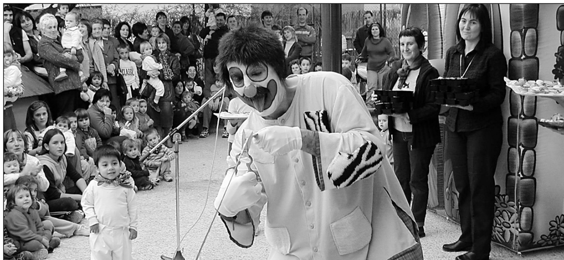
Porrotx zinta mozten, ume eta gurasoak begira eta atzean merienda noiz jaten hasiko zain.

Alkatearen hitzetan hau hasiera da, baina, web orriari benetan etekina ateratzeko Udaletxeko funtzionamentua poliki poliki horretara egokitzen joan behar da eta Udaleko zerbitzu eta sailak koordinatzen lan handia egin behar da. □