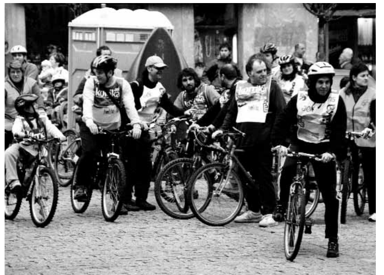
Korrika kulturalaren barruan, bizikleta martxa.

mahaiak jarriko dituzte, beste batzuk bazkaria banatu eta besteek mahaiak jaso; beraz horixe izango da beste lantalde bat. Eta herria DEKORATU edo APAINDU ere egingo dugu banderinak, txartelak eta abar jarritz, eta horretarako beste lantalde bat dago. Eta azkenik ikasleen txoko hau ere egin behar dugu, eta batzuk hauxe egingo dugu: lau orrialdeok bete; gure lantaldearen lana da IKASLEEN TXOKOA egitea KRONIKAN ateratzeko eta jendeari informazioa emateko. ||