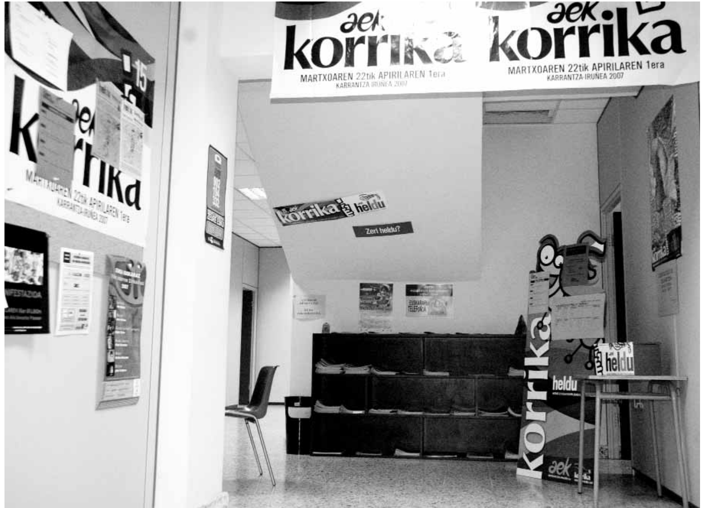
AEK euskaltegian Korrika-giroa nabaria da egunotan.

Korrika txikia eta gaztea ia herri guztietan egiten dugu, baina korrika kulturala ez da beti bera izaten. Herri bakoitzak berea antolatzen du. ||