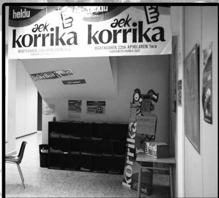
Nola antolatzen dugu euskaltea / III

æk heldu ELKARLANARI EUSKARARI HERRIARI HITZARI LEKUKOARI