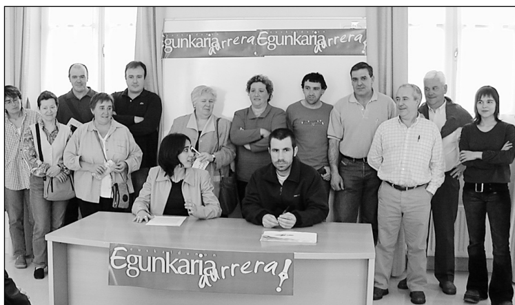
Egunkariaren aldeko batzordeak, Udalak eta eragile sozialek harpidetza kanpaina babestu dute.

Egunkariaren proiektuan harpidetzak duen garrantzia kontuan hartuta, batzordea dagoeneko ari da harpide berriak egiten. Lan horretan, Udalaren eta hainbat gizarte eragileren babesa jaso du Egunkariaren aldeko batzordeak. Udalak justu Egunkaria itxi aurre hartan