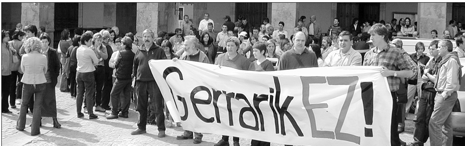
'Gerrarik Ez' lemaekin atzo Hernaniko Udaletxe aurrean egindako kontzentrazioa.

DOBERA Euskara Elkarteak urteko batzarra egingo du ostiral honetan, Larramendi kalean. Aurten 10 urte bete dituen euskara elkarteak 2002ko balantzea egingo du, eta horrekin batera 2003ko egitasmoen berri ere emango du. Aurten, bestalde, zuzendaritza karguak berrikustea egokitzen da. Batzarra arratsaldeko 19:00etan izango da. Doberak bazkide guztiei dei egin die batzarrera azaltzeko. □