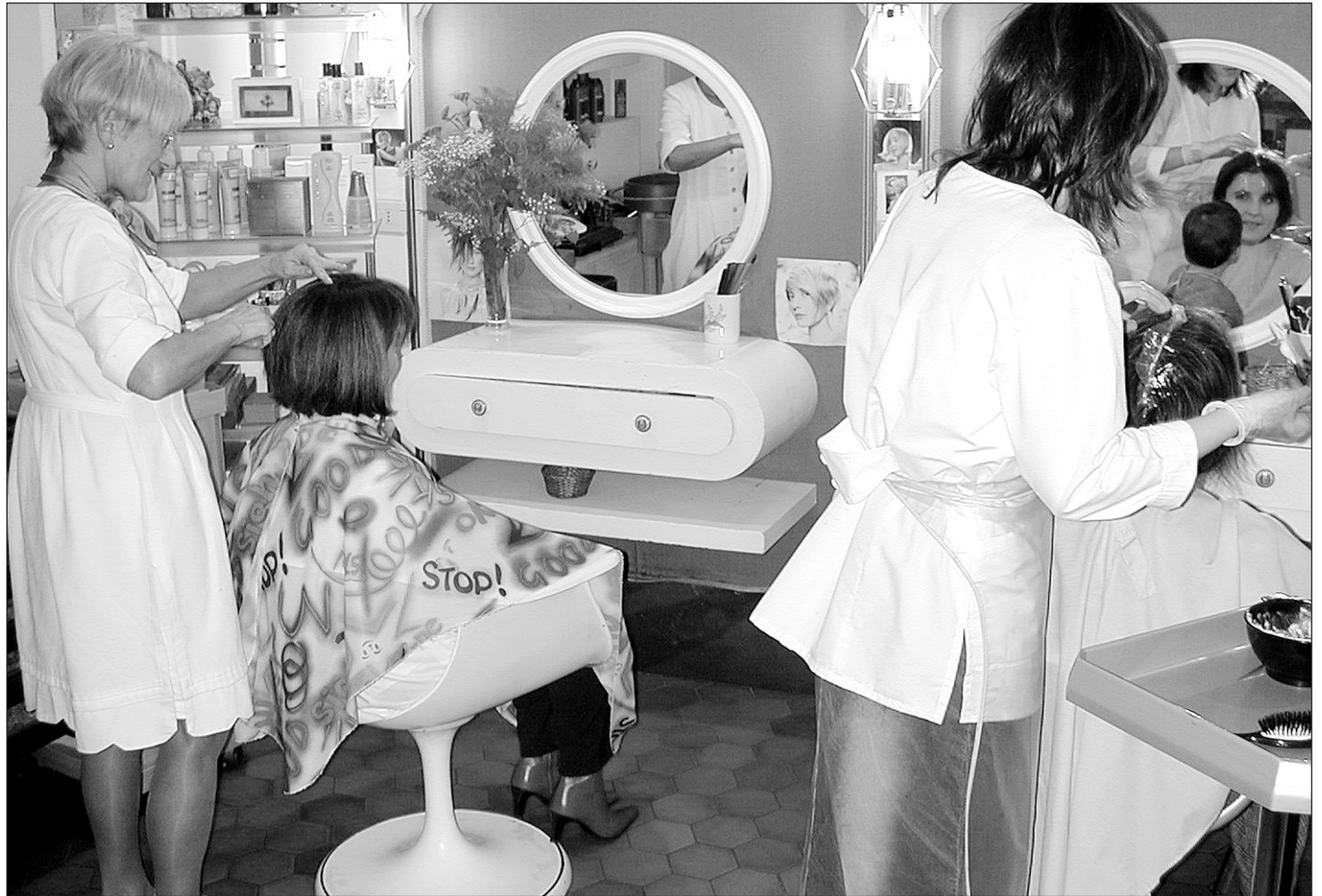
Pelukerietako bezeroa pixkanaka aldatzen ari da. Gaur egun orraztera bakarrik jende gutxi joaten da pelukerira.

Hala ere, asko dira pelukeroaren esku uzten dutenak beren look-a . Kasu horretan pelukeroak bere eskua erakutsiko du, eta saiatuko da egokitzen, beraren gustoa eta klientearena. Horrek markatzen du, nolabait, pelukeria