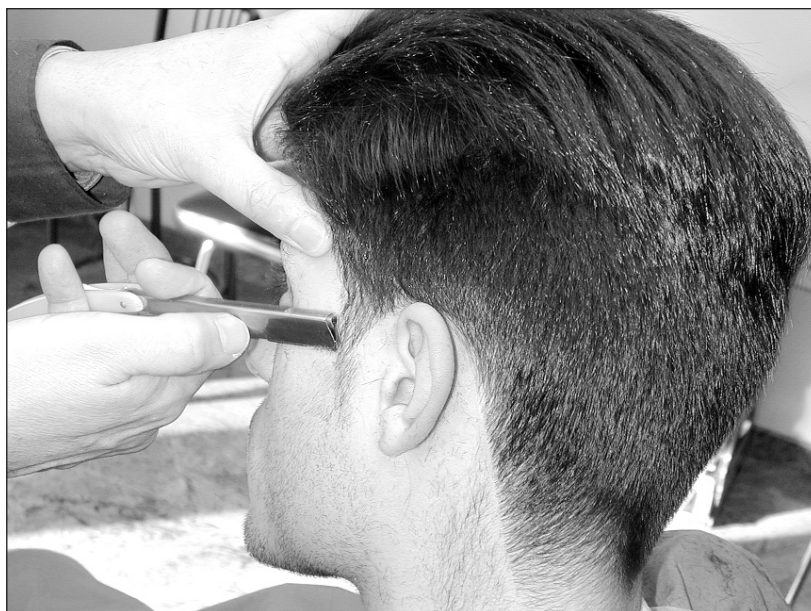
Lehenago barberiak pixkanaka pelukeria izatera pasatzen ari dira.

ari dela sartzen pelukerietan. Bada jendea konformatzen ez dena ilea moztea edo tin-