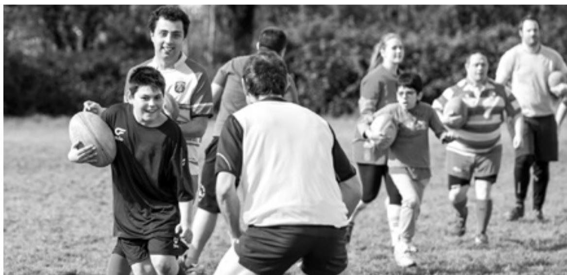
Hernaniko talde barneratzaileak saio politarekin gozatu zuen igandean, Landaren.