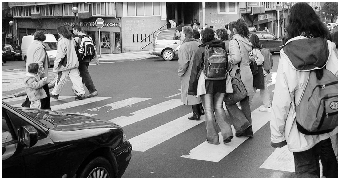
Mobilitate Planak dioenez 4 hernaniarretik 3k oinez egiten ditu herri barruko bideak.

bitzu eta merkataritzaren bueltan. Estudioaren hirugarren konklusioa da Hernaniko mobilitatea Donostiarako joerak markatzen duela, baina, hala ere, jende asko ibiltzen dela oinez (hernaniarrek herri barruan egiten dituzten biajeen % 73 oinez egiten dituzte), eta estudioak dio elementu hori