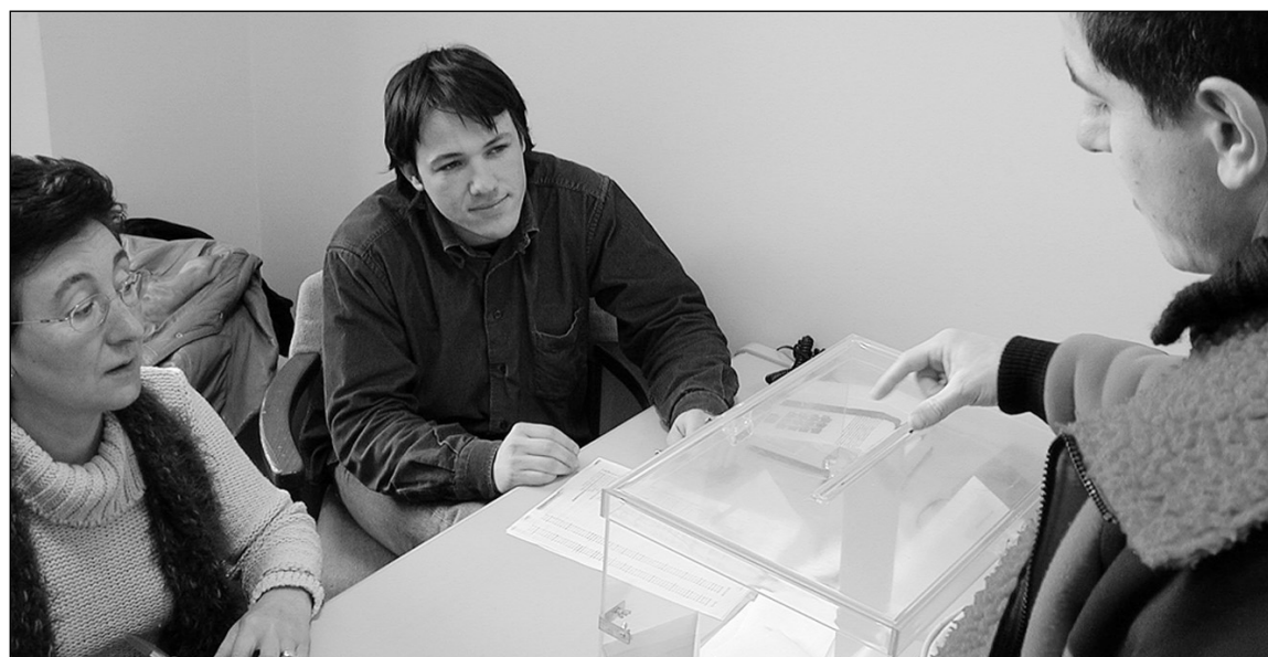
Udaletxeko langile bat botoa ematen, astelehenean izandako hauteskunde sindikalean.

Joseba Pagazaurtunduren gorputza Zorroagako tanatorioan egon zen, eta Polloen erraustu zuten gero. Familiak hala eskatuta, ez da bere aldeko hileta elizkizunik izan. □