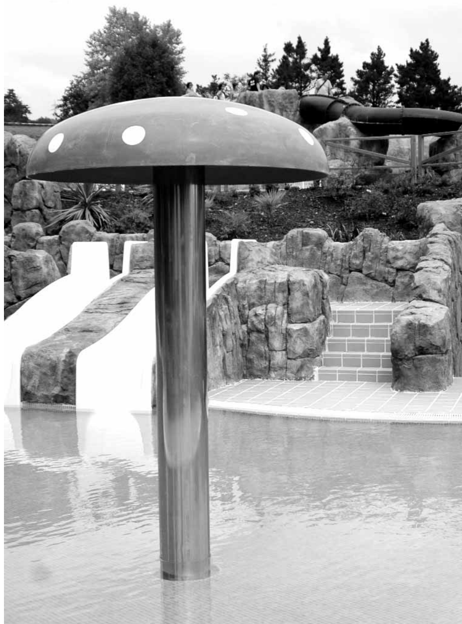
Hernaniko igerileku irekiak.