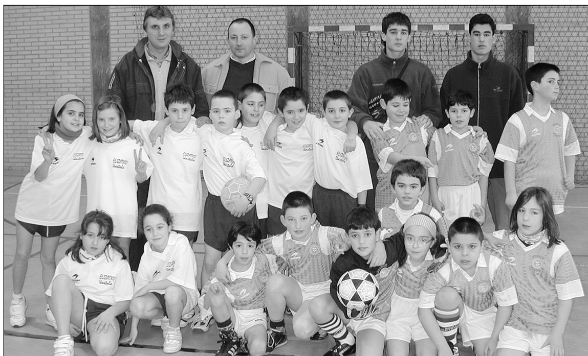
Areto futboleko gazteak pozik elkarrekin.