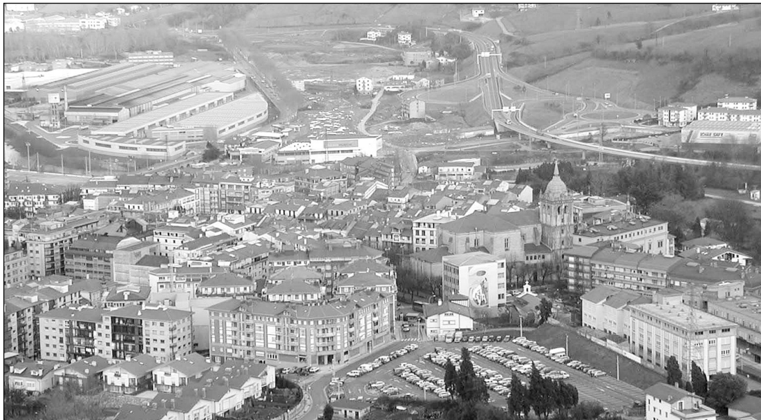
Agenda 21-en helburu nagusia da Hernaniko garapenak ingurugiroa izatea oinarrietako bat.

Radiografiaren datu batzuk Ortzadar Enpresak egindako azterketak nabarmendu du