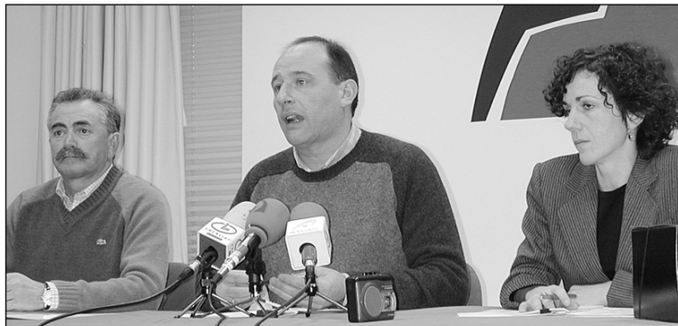
San Markoseko arduradunak atzoko prentsaurrekoan.

San Markosek galdeketa bat aurkeztu du jendeak zer iritzi duen jakiteko. Atzo esan zutenaren arabera % 70 Plan Integralaren aldekoa da eta egokia ez dela diotenak % 7 dira. Jendeak interesik gehi-