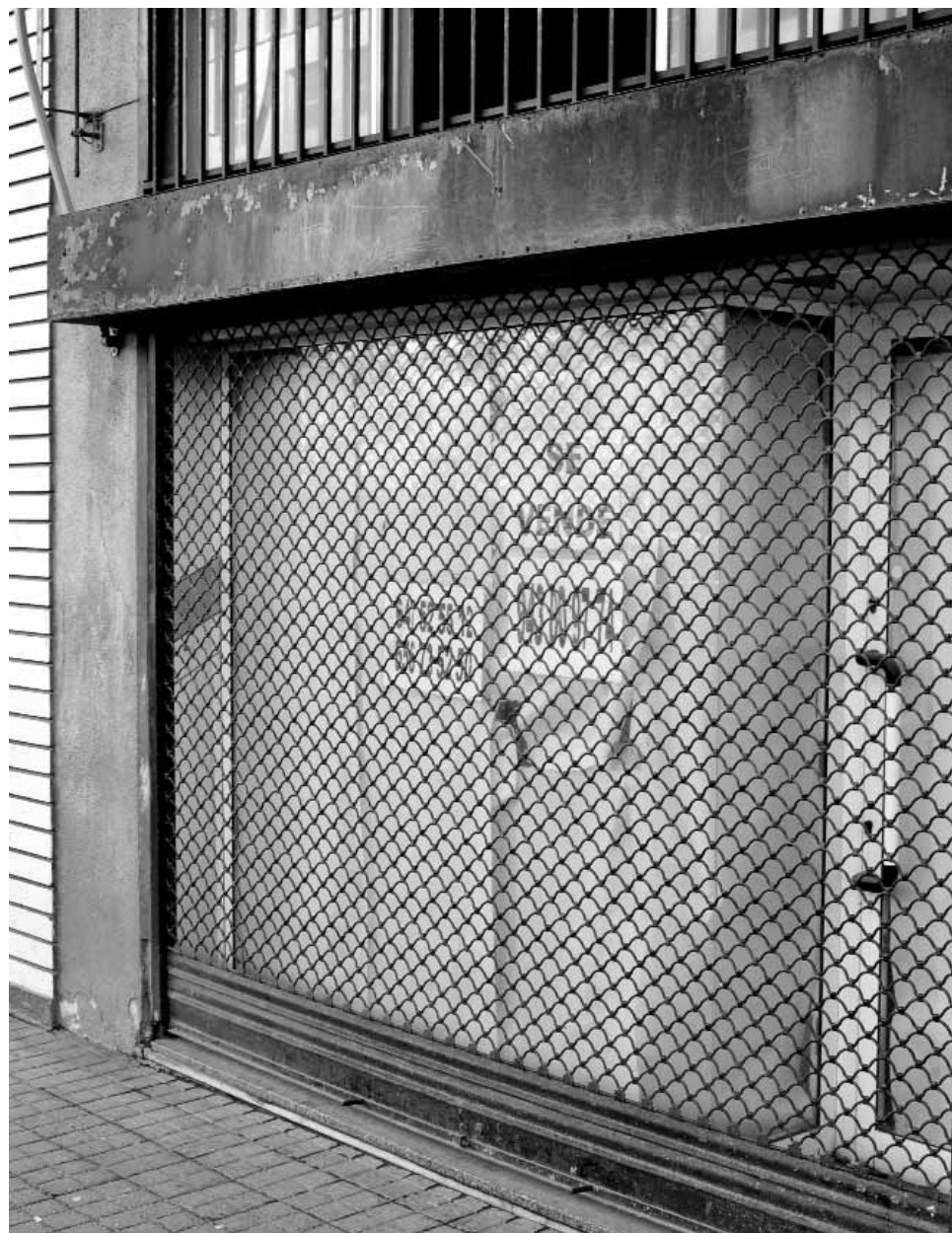
Etxebizitza bihurtu daitekeen Hernaniko lokal huts bat

nolako eragina izan duen Hernanin ikusi ahal izateko goiz da oraindik. Batetik, krisiak merkatu inbiliariorioan izan duen inpaktuak merkatu hau asko moteltzea ekarri duelako. Beste alde batetik, araudiaren arabera lokalak egokitu ahal izateko, bere jarduera komertziala eten zutenetik lau urte igaro behar direlako eta lokal askok oraindik ez dutelako baldintza hori betetzen.