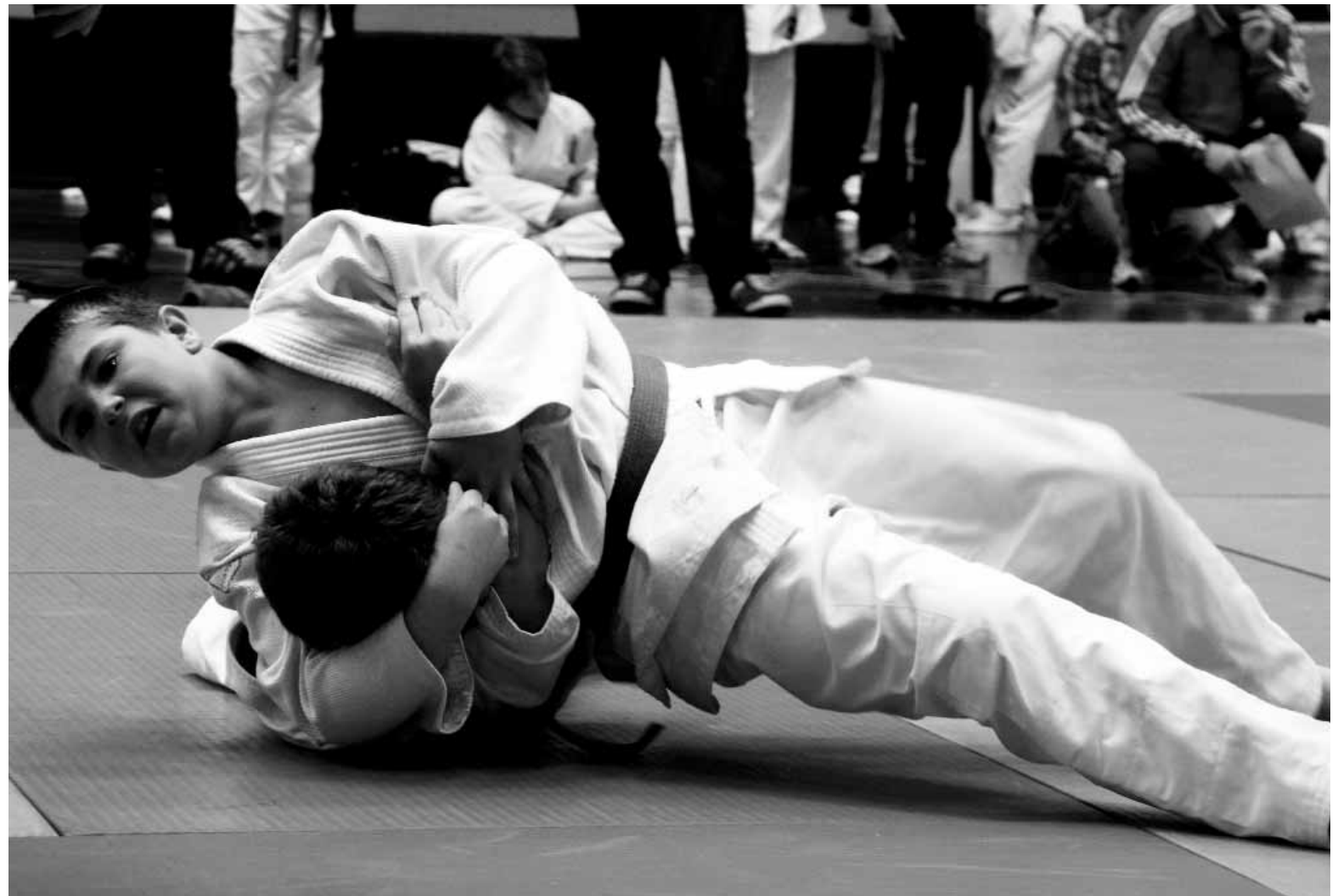
Bi judoka 2009ko Gipuzkoako Txapelketa borrokaldi batean

Hernanitik 5 judoka arituko dira gaurkoan infantilen txapelketan. Neskek dominak lortzeko aukerak badituzte, eta mutilek lan zailagoa izango dute, Hernaniko Judo El-