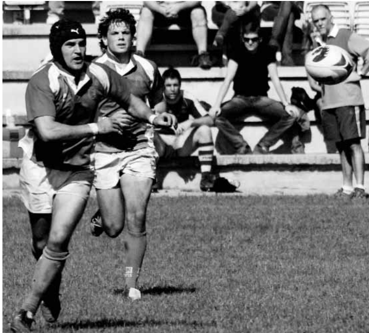
Partidu garrantzitsuak dituzte Hernaniko taldeek asteburuan.

Oviedo taldea da Hernanik atzean utzi dezakeen lehendabizikoa, bihar irabazten badu. Oviedo sailkapenean laugarren dioa, baina oraindik badu aukeraren bat iguera fasean sartzeko. Ez da partidua erraza biharkoa. Oviedok kalitate oso oneko jokalariek ditu (2 argentinarrak eta 2 Zeelanda Berrikoak), eta haiek zaintzeak berebiziko garrantzia izango du.