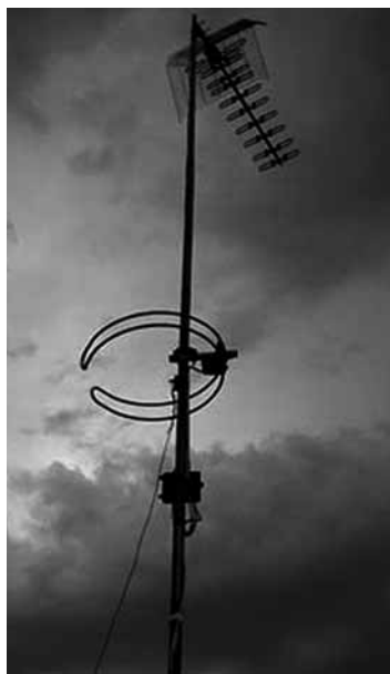
Laster LTD antena beharko da.

1) Mendekotasuna izatea, II edo III graduaren eta 65 urte