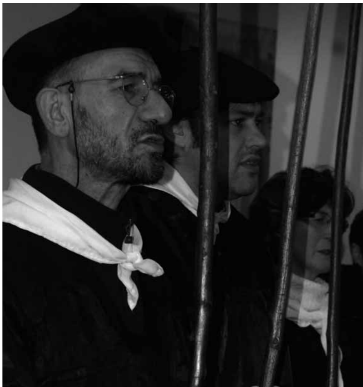
Santa Ageda bezpera, otsailaren 4an izango da urtero bezala.

Goiz Eguzki abesbatza 17:00etan abiatuko da Sandiusterri egoitzaatik. ||