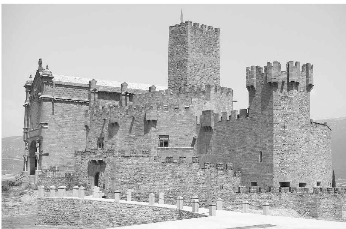
Xabierko gaztelua, Frantzisko Xabier bertan jaio zen (1506), artean, Nafarroa independentea zela.

Hilaren 16an, berriz, Nafarroa Garaia konkista izango dute hizketagai. 1512 urtean zentratuko dira eta aitzindariak eta ondorioak azalduko dituzte. Handik bi egunetara, hilaren 18an emango zaio jarraipena Lapurdi, Baxenabarre eta Zuberoa Frantziapen geratu zireneko kontaktarekin. Eta azken solasaldia hilaren 23an izango da eta bertan azalduko dira soberaniaren aztarnak.