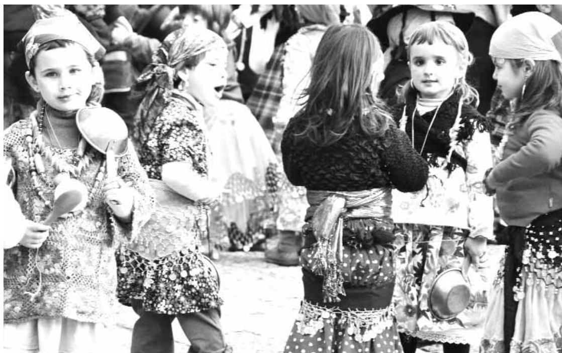
Kaleak girotu ondoren, kanpamendua jarri eta txokolatea hartu zuten Langileko ikasleak atzo Plazan.

Helduei aurre hartuta atzo Langileko ikasleak ibili ziren mailu eta zartaiak eskutan kaleak girotzen. Plazan kanpamendua jarri eta txokolatea hartuta ospatu zituzten kaldereroak. ||