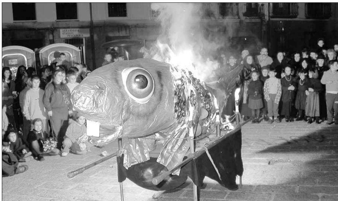
Plazaren erdian eman zitzaion su sardinari. Apenas jateko moduan geratu zen!