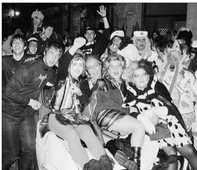
Gazte koadrila, larunbat gauean mozarrotuta.

‘Entierro de la sardina’ Urteroko ohitura da sardina erretzea inauteriak bukatzeko. Aurten ere suak bukatu dituzte. □