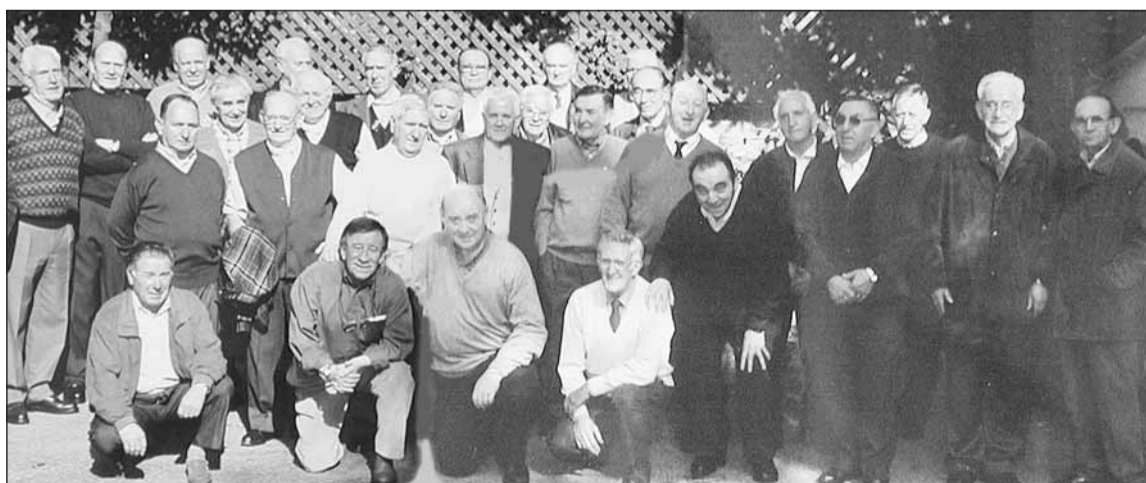
1953ko kintoak Txantxangorri, igandean.

1953ko kintoez urteko bazkaria izan zuten igandean. Urtero elkartu eta egun pasa egiten dute 1953ko kintoez. Aurten ere meza eta hamaietakoia izan dituzte eguna hasteko. Bazkaritan 30en bat lagun elkartu ziren.