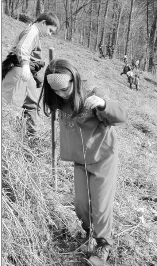
Izan zen arbolak txuxerasko jarri zituenik.