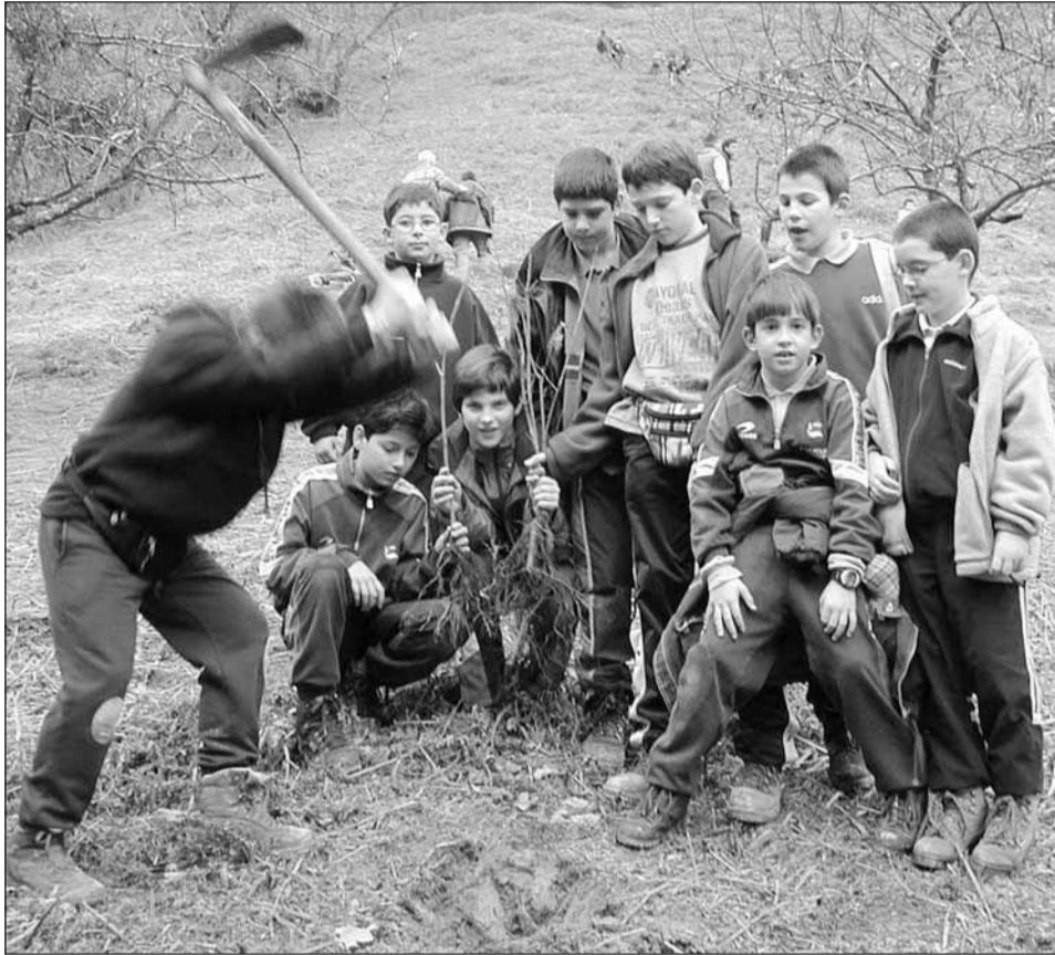
Bat lanean eta koadrila begira, iazko Zuhaitz Egunean. Ederra martxa!