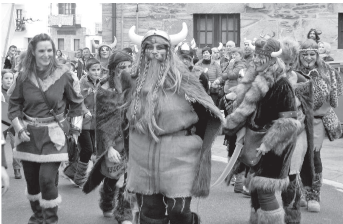
Vikingoz jantzita, ederki pasa zuten goizuetarrek joan den urtean, Inauterien astelehenean.

Eta asteartekoa, ez da gutxiago izanen. Gosaldu ondoren, herriko kaleetan dantzari ariko dira Mozorroak, eta bazkalostean, Zahagi Dantza izanen da herritarrek bilduko dituen, Motzanan hasita. DJ Txokoren musikak eta Mozorroen afariak emanen diete bukaera Inauterietara, kontuak egin aurretik. K