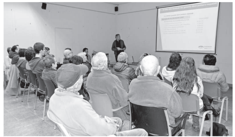
Ereñotzuar guztiak daude deituta, gaurko Auzo Batzarrean.

Horrekin guztiarekin, hiru dimentsiotako maketak ere osatu ditu Mitxelenak, Goizuetako eta inguruko olak irudikatzen dituztenak. K