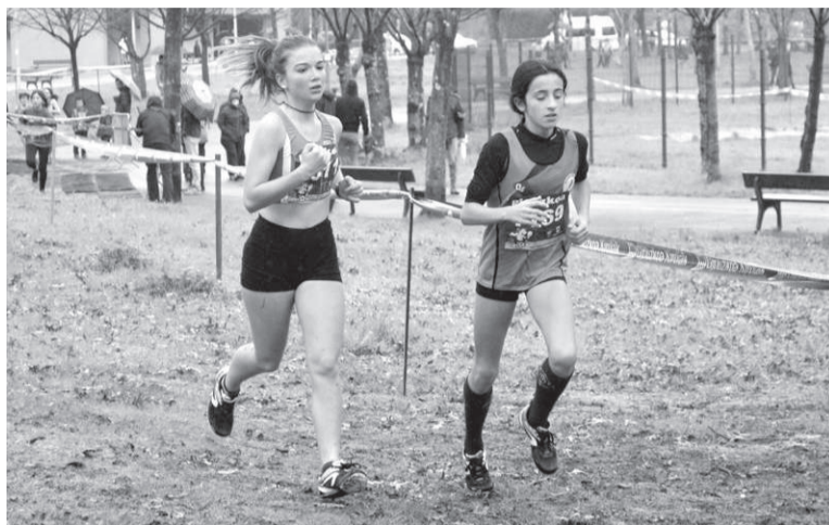
Atletismo pistaren barruan zein kanpoaldean ariko dira bihar, korrikalariak.

Mutil infantilen txanda izango da aurrena, 11:00etan puntuan; eta 2.736 metroko ibilbidea osatu beharko dute haiek. Segidan aterako dira neska infantilak, 11:20etan, pixka bat laburragoa izango den ibilbidea egiteko: 2.122 metro. Distantzia hori bera osatu beharko dute mutil alebinek, 11:35etan abiatuta; eta 1.508 metro egingo dituzte neska alebinek, 11:50etan hasita.