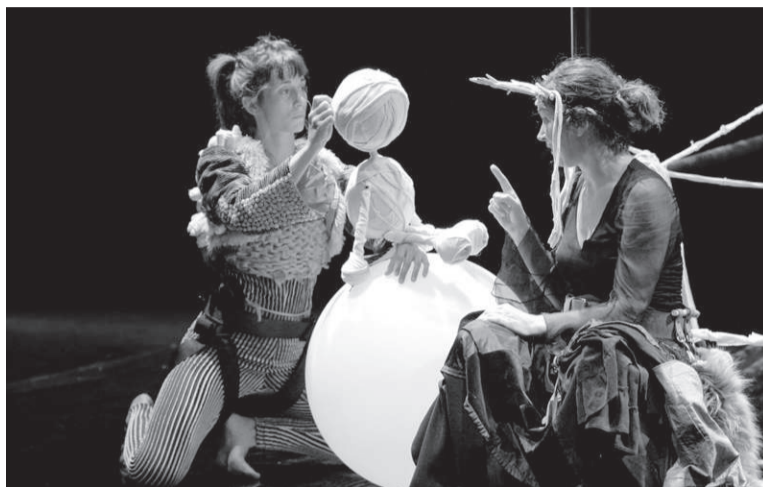
Lehen sorginei beldur izan, eta sorgin bihurtu den neska da protagonista.

zientzietan sorginei, baina, denborarekin, 'sorgin' bihurtu da.