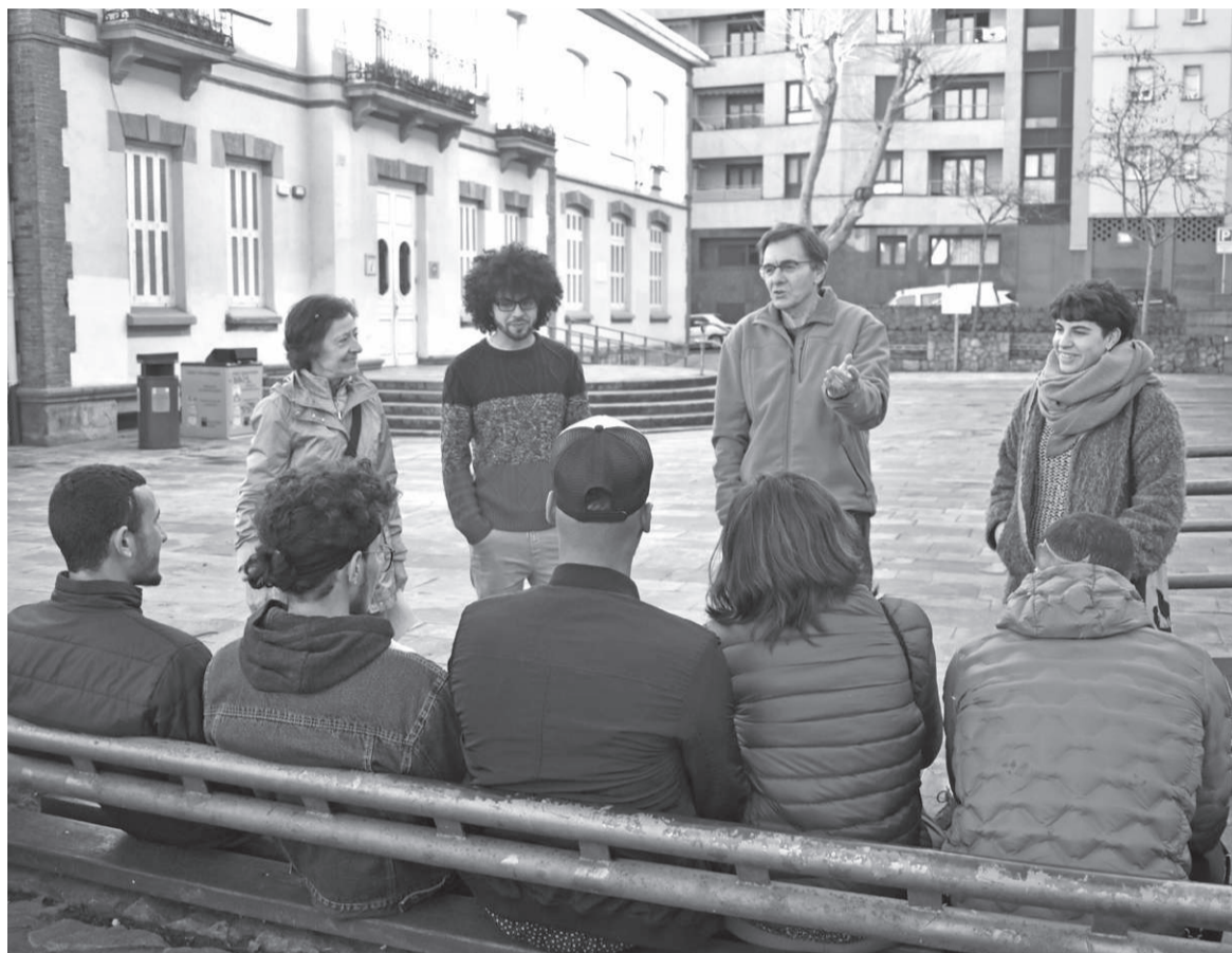
Behar materialak bakarrik ez; Harrera Sarea behar ez-materialak ere asetzen siatzen da; «bidelagun izaten».

Baina bestelako behar batzuk ere izaten dituzte. «Komu-