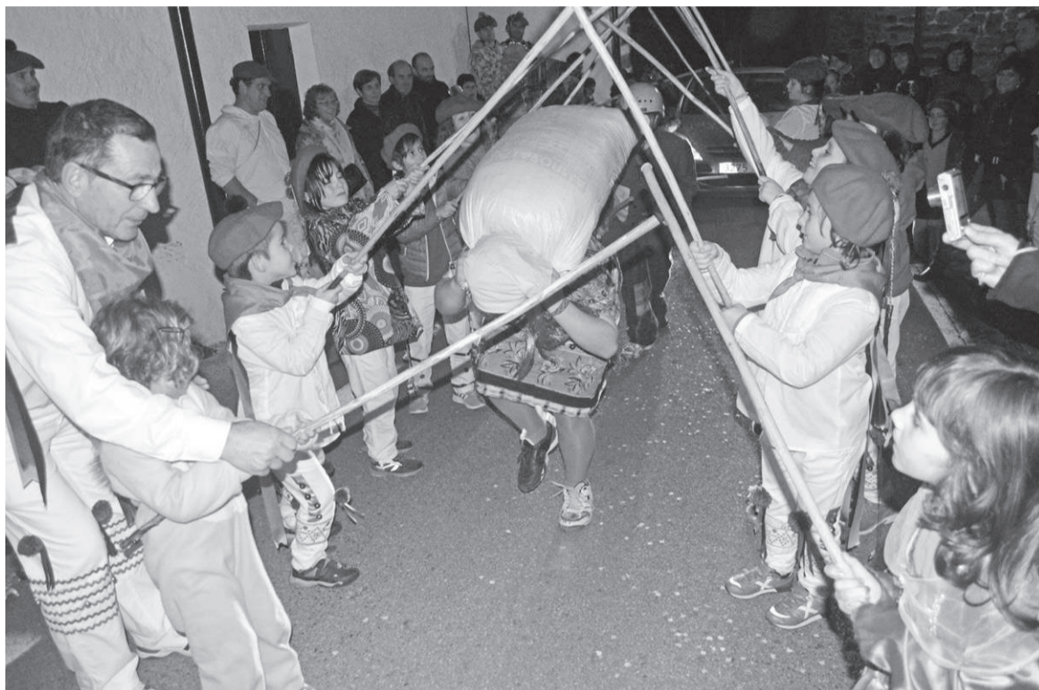
Haurrek egingen dute Zahagi Dantza, aurten ere, 2016tik orain arte bezala.

Eta eguna modurik onenean bukatzeko, afari herrikoa antolatu dute elkartean; eta bingo musikatua izanen da ondoren, saltsa jartzeko. K