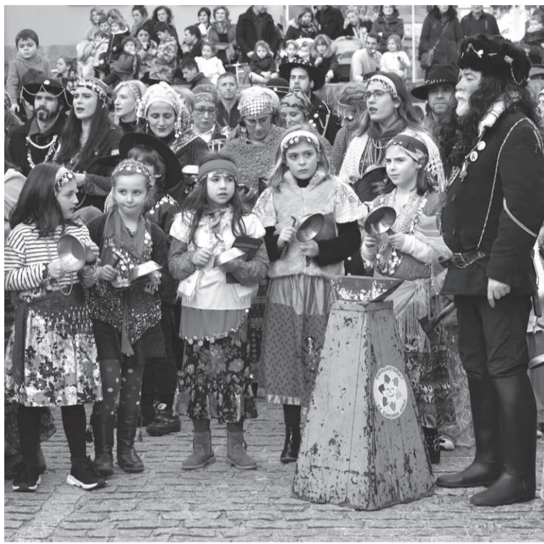
Kaldereroak Ergobiko plazatik irtengo dira arratsaldean.

20:00ak aldera espero da Joseba Barandiaran plazara iris-