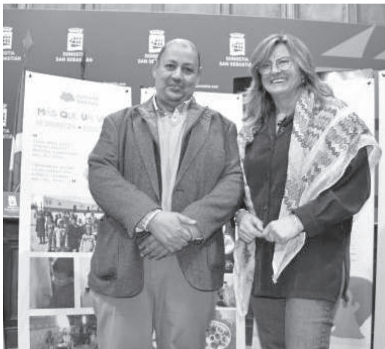
Donostiako udaletxean aurkeztu dute 'Oporrak Bakean' programa.

10 eta 12 urte bitarteko haurrak udako bi hilabeteetan euskal familiekin bizitzea errazten du, basamortuko baldintza gogorretatik aldi baterako aldentzeko, elikadura egokia eskaintzeko, hazten laguntzeko, azterketa medikoak egiteko eta euskal kulturaren eta sahararren arteko harremana sustatzeko.