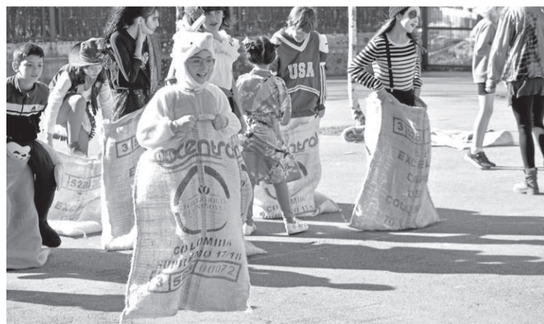
Pasa den urtean jolastokian antolatu zituzten jokuan Herri Eskolan.

Antzerkiari laguntzeko, noski, musikaririk ez da faltako: txaranga, danborrada, txistulariak, trikitilariak... K