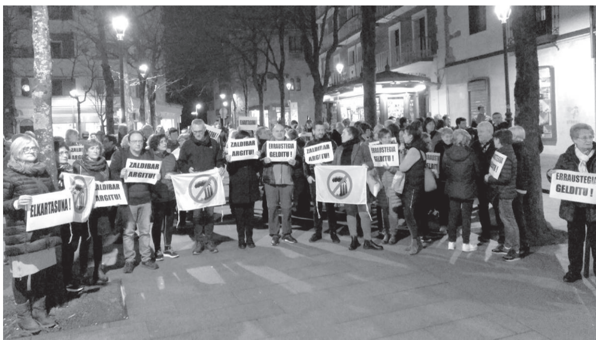
Plaza Berrin elkartu ziren herritarrek, Zaldibarko gertaerak salatzen.

Kanpainarekin segi egingo dutela adierazi zuten, eta argitu zuten, bertero bezala, maiatzean gutuna bidaliko zaiela 18 urte egiten dituztenei, egitasmoaren berri emateko. K