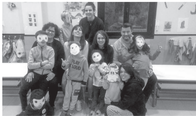
Gurasoak eta haurrak elkartzeko dirak.

Bi urtetik behin egiten duten moduan, maila bakoitzak kanta, antzerki, dantza... bat eskainiko du, antzeppen orokor baten barruan. Aurtengoa, printzipioz behintzat, irudizko hiri bat izango da denak bilduko dituen. Eta Superheroiak gaia hartuta bertan izango dira denentzako ezagunak diren superheroi desberdinak. K