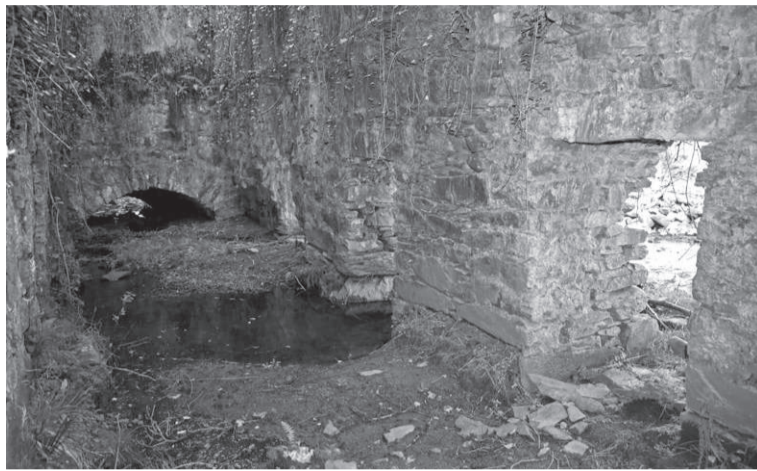
Iberoko burdinola, gaur egun. Hari buruz ere ariko dira, gaurko hitzaldian.

Zehazki, herrian bertan eta zortzi bat kilometroko ingurunean dauden edo egon diren burdinolen berri emanen dute; dokumentuetan azaltzen diren 26 burdinolak, hain justu. Horiei buruzko azalpenak, datu, krokis, plano zein maketetan oinarritutako dituzte.