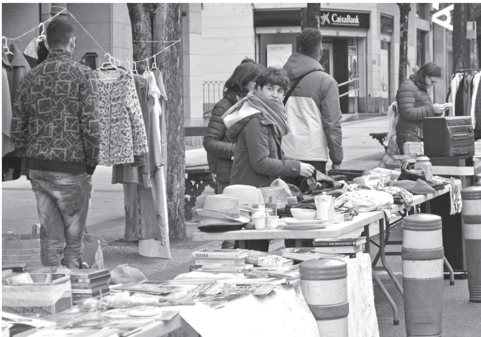
Bigarren eskuko azokan postua jarriko du aurrerantzean Harrera Sareak, dirua lortzeko.

Azken puntu horietan jarri dute indarra. «Bilerak Biteri kultur etxean egiten ditugu, eta irekiak dira. Edonor dago gonbidatuta» K