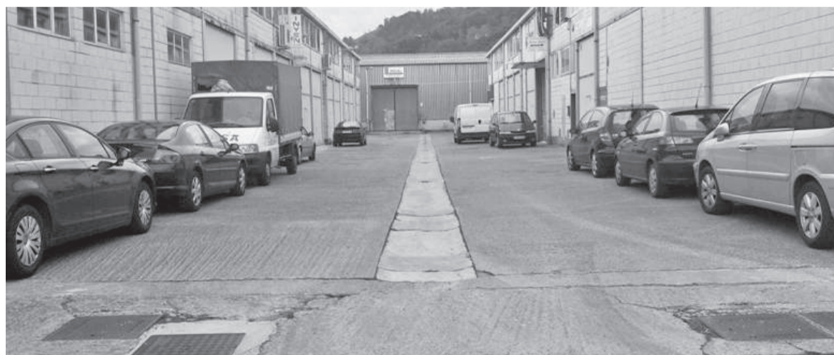
Industrialdeetako hiri-hondakinen bilketa aztertuko du Udalak.

zteaz gain, Garbitaniatik atez ateko tramiteak hasi zituen EAJren gobernuak. «Astigarragako Udalak EH Bilduk enpresan inbertitutako 121.000 euroak berreskuratu behar zituen, baina gobernu abertzale berriak enpresaren irteera geldiarazi du. Garbitanian jarraitzeko arrazoi