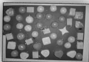
Xaboi Tailerra/ III

Animazio Soziokulturaleko 2garren mailako ikasleak, Amnistia Internazional-ekin elkarlanean / II