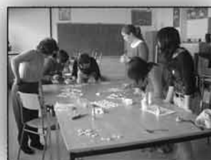
Bitxikeriak / III

Donostiako Nazioarteko Zinemaldia Lehen Sorospen ikastaroa Lanbide heziketako Praktikak atzerrian Pastak egiteko tailerra