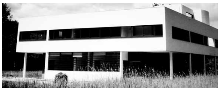
Villa Saboye eraikina.

Bizitza ulertzeko modu berria XX. mendearen lehen erdialdean eman ziren krisi ekonomikoak, mugimendu iraultzaileak eta mundu gerrak, tentsio sozial anitz sortu zituzten. Horregatik, artistek, munduaren gogorkeri hura salatu nahi izan zuten. Hauek lengoia eta forma tradizioetatik urrundu