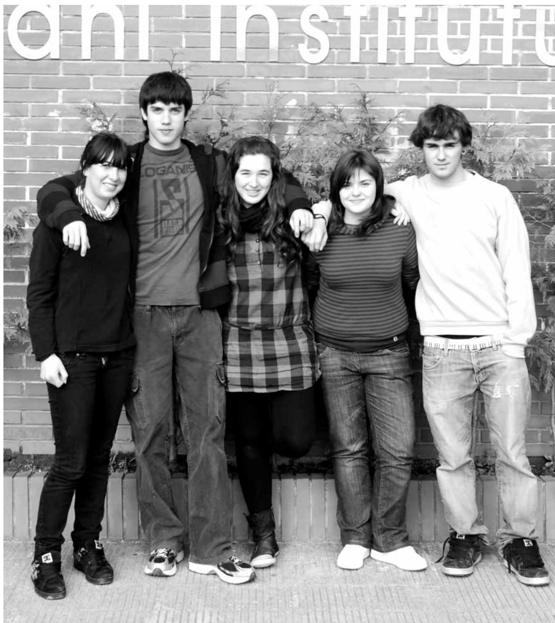
Hernani Institutuko ikasleak izan dira gaurko alearen egileak.