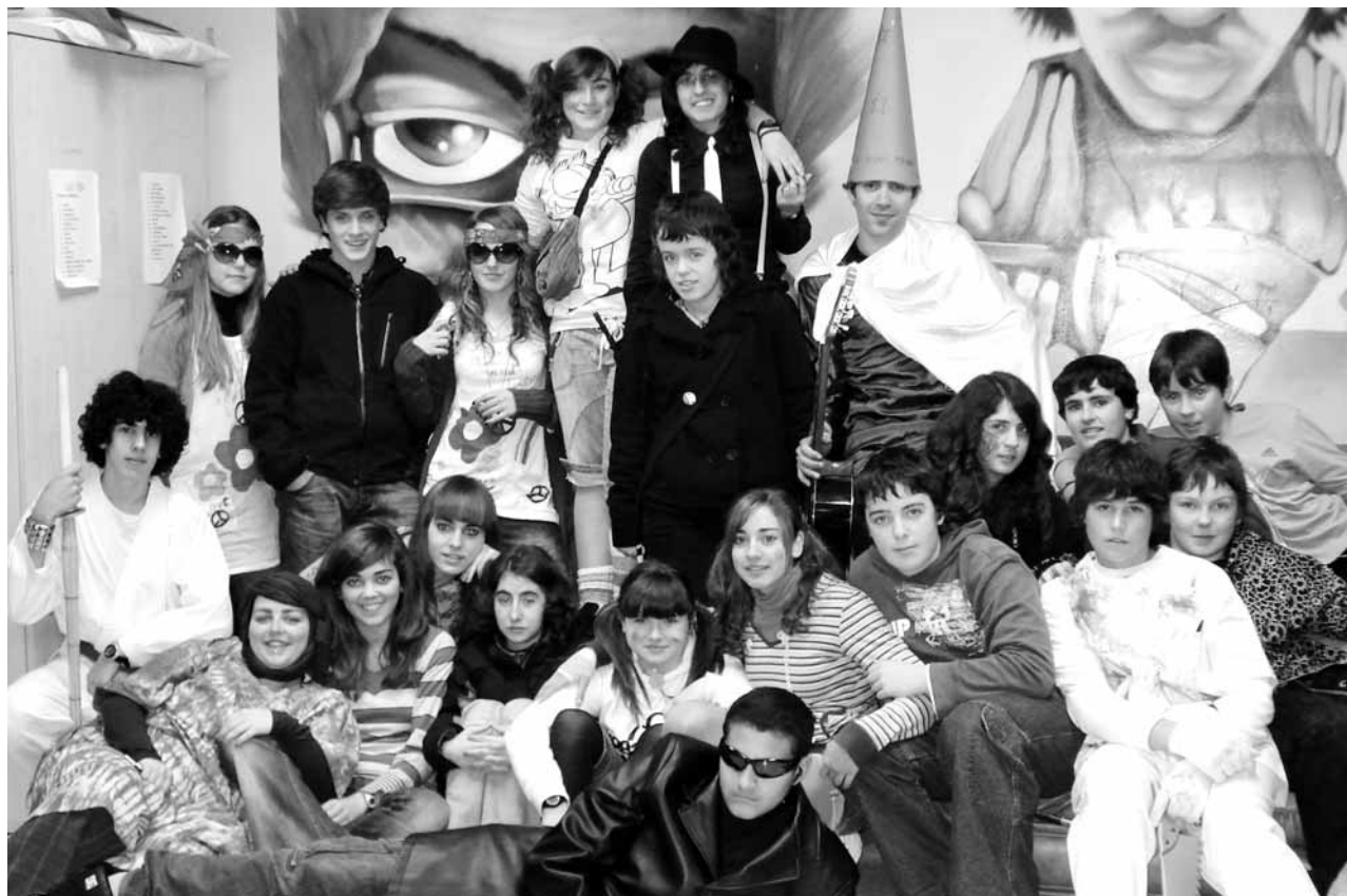
Gazteengandik datorren inizatiba Gazte Txokoan sortu zen.

Baina gazteak ez dira diru bilketa bakarrik mugatzen, haien helburu nagusia beste bat baita; Munduko haur eta gazteen egoerari buruz informazioa hedatzea eta proiektu kultural, sozial eta hezitzaileak diseinatu eta egitea baitituzte lehentasunak. Horrela,